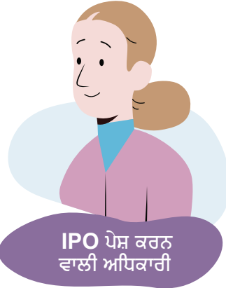
IPO ਪੇਸ਼ ਕਰਨ ਵਾਲੀ ਅਧਿਕਾਰੀ

ਤੁਹਾਡਾ ਸਮਾਜਕ ਕਾਰਜਕਰਤਾ ਅਤੇ ਵਕੀਲ ਤੁਹਾਡੇ ਨਾਲ ਅਪੀਲ ਦੀ ਸੁਣਵਾਈ 'ਤੇ ਜਾਣਗੇ। ਉਹ ਤੁਹਾਡੇ ਲਈ ਉੱਥੇ ਮਦਦ ਦੇ ਰੂਪ ਵਿੱਚ ਮੌਜੂਦ ਹਨ, ਪਰ ਤੁਹਾਨੂੰ ਸਵਾਲਾਂ ਦੇ ਜਵਾਬ ਆਪਣੇ ਸ਼ਬਦਾਂ ਵਿੱਚ ਦੇਣ ਦੀ ਲੋੜ ਹੋਏਗੀ। ਕਈ ਵਾਰੀ ਟ੍ਰਿਬਿਊਨਲ ਮੈਂਬਰ ਤੁਹਾਡੇ ਵਕੀਲ ਅਤੇ ਤੁਹਾਡੇ ਸਮਾਜਕ ਕਾਰਜਕਰਤਾ ਨੂੰ ਤੁਹਾਡੀ ਪਨਾਹ ਦੀ ਅਰਜ਼ੀ ਨਾਲ ਸਬੰਧਤ ਕੁਝ ਮੁੱਦਿਆਂ ਬਾਰੇ ਤੁਹਾਡੇ ਵਾਸਤੇ ਬੋਲਣ ਲਈ ਕਹੇਗਾ। ਤੁਹਾਡਾ ਵਕੀਲ ਇਸ ਸਬੰਧ ਵਿੱਚ ਕਨੂੰਨੀ ਬਹਿਸ ਕਰੇਗਾ ਕਿ ਤੁਹਾਨੂੰ ਪਨਾਹ ਦੀ ਲੋੜ ਕਿਉਂ ਹੈ।