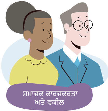
ਸਮਾਜਕ ਕਾਰਜਕਰਤਾ ਅਤੇ ਵਕੀਲ

ਤੁਹਾਡਾ ਸਮਾਜਕ ਕਾਰਜਕਰਤਾ ਅਤੇ ਵਕੀਲ ਤੁਹਾਡੇ ਨਾਲ ਅਪੀਲ ਦੀ ਸੁਣਵਾਈ 'ਤੇ ਜਾਣਗੇ। ਉਹ ਤੁਹਾਡੇ ਲਈ ਉੱਥੇ ਮਦਦ ਦੇ ਰੂਪ ਵਿੱਚ ਮੌਜੂਦ ਹਨ, ਪਰ ਤੁਹਾਨੂੰ ਸਵਾਲਾਂ ਦੇ ਜਵਾਬ ਆਪਣੇ ਸ਼ਬਦਾਂ ਵਿੱਚ ਦੇਣ ਦੀ ਲੋੜ ਹੋਏਗੀ। ਕਈ ਵਾਰੀ ਟ੍ਰਿਬਿਊਨਲ ਮੈਂਬਰ ਤੁਹਾਡੇ ਵਕੀਲ ਅਤੇ ਤੁਹਾਡੇ ਸਮਾਜਕ ਕਾਰਜਕਰਤਾ ਨੂੰ ਤੁਹਾਡੀ ਪਨਾਹ ਦੀ ਅਰਜ਼ੀ ਨਾਲ ਸਬੰਧਤ ਕੁਝ ਮੁੱਦਿਆਂ ਬਾਰੇ ਤੁਹਾਡੇ ਵਾਸਤੇ ਬੋਲਣ ਲਈ ਕਹੇਗਾ। ਤੁਹਾਡਾ ਵਕੀਲ ਇਸ ਸਬੰਧ ਵਿੱਚ ਕਨੂੰਨੀ ਬਹਿਸ ਕਰੇਗਾ ਕਿ ਤੁਹਾਨੂੰ ਪਨਾਹ ਦੀ ਲੋੜ ਕਿਉਂ ਹੈ।