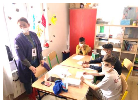
Radionica neformalnog obrazovanja u Bosilegrad PTC-u, @Indigo, mart 2021.

IKEA SEE, korporativni partner UNHCR-a , izdao je poziv za prijave za program rekvalifikacije za izbeglice i azilante u Srbiji, ne bi li poboljšali njihove izgleda za zapošljavanje.