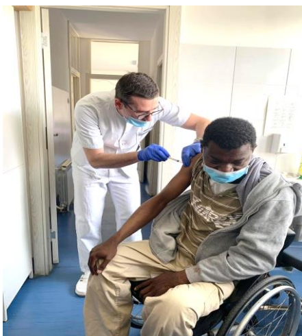
Vakcinacija protiv Kovida u Krnjača Centru za azilante u Beogradu, @UNHCR, 26. mart 2021.

26. marta, vlasti u Srbiji započele su kampanju vakcinacije tražilaca azila, izbeglica i migranata smeštenih u 19 vladinih centara širom zemlje. čime je Srbija postala jedna od prvih zemalja u Evropi koja je počela vakcinaciju izbeglica i azilanata kako u centrima tako i onih u privatnom smeštaju . Petsto pedeset izbeglica i migranata u zvaničnim centrima iskazalo je interes za vakcinacijom i 309 ih je vakcinisano do kraja marta. Dodatnih 32 izbeglice u privatnom smeštaju vakcinisano je protiv Kovida. Da bi promovisali vakcinaciju, Batut Institut za javno zdravlje, Komesarijat za izbeglice Republike Srbije (KIRS), SZO i UNHCR su senzibilizirali izbeglice i migrante u pogledu promocije zdravlja i zaštite od Kovida.