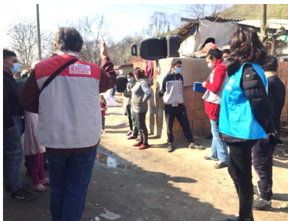
Zajedničke aktivnosti na promociji zdravlja UNHCR-a i DSI-ja u neformalnom romskom naselju Tošin bunar, Beograd, @UNHCR, 19. mart 2021.

Broj prisutnih u azilnim centrima (AC) i prijemno/tranzitnim centrima (PTC), se ponovo malo smanjio u odnosu na kraj februara, na 4.460 krajem marta 2021. Ovaj broj uključuje 1.754 osoba poreklom iz Avganistana, 888 iz Sirije, 317 iz Pakistana, 206 iz Somalije, 188 iz Bangladeša i 1.107 iz 50 drugih zemalja. 3.797 su odrasli muškarci, 256 odrasle žene i 407 deca, uključujući 74 dece bez pratnje (DBP). Ukupno je izbrojano 5.463 novih izbeglica i migranata prisutno u zemlji krajem marta , uključujući i one koji borave van vladinih centara. Zvaničnici su nastavili da sistematski skupljaju izbeglice i migrante koji su van centara, u centru Beograda i u pograničnim regijama, i da ih smeštaju u oficijelne centre u kojima ima slobodnih mesta.