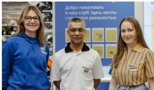
Ясин в магазине ИКЕА в Москве