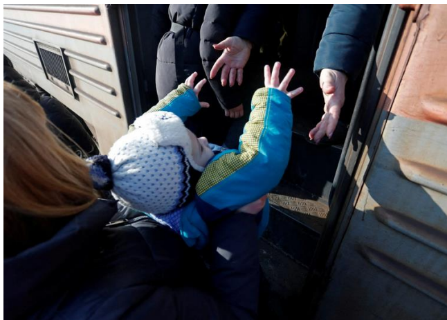
Украина. Эвакуированные жители садятся в поезд на железнодорожной станции перед отъездом из Восточной Украины