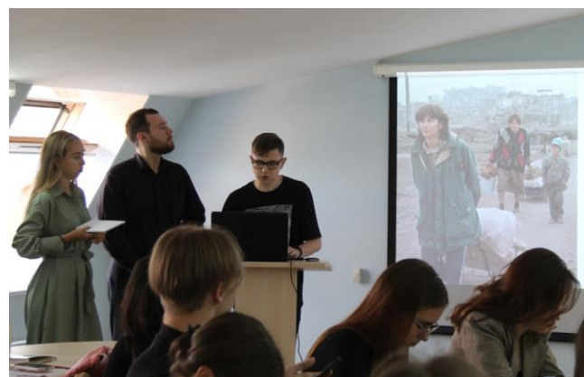
Студенты выступают с презентацией на VI Летней школе по миграции в Санкт-Петербурге. 23 августа 2022 года