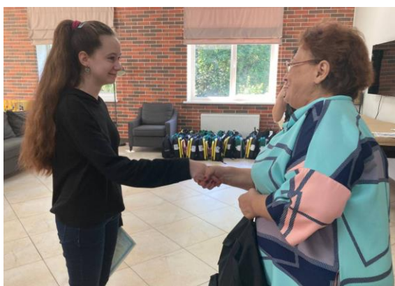
Раздача школьных принадлежностей детям-беженцам из Украины силами РКК в пункте временного размещения в Туле. 12 августа 2022