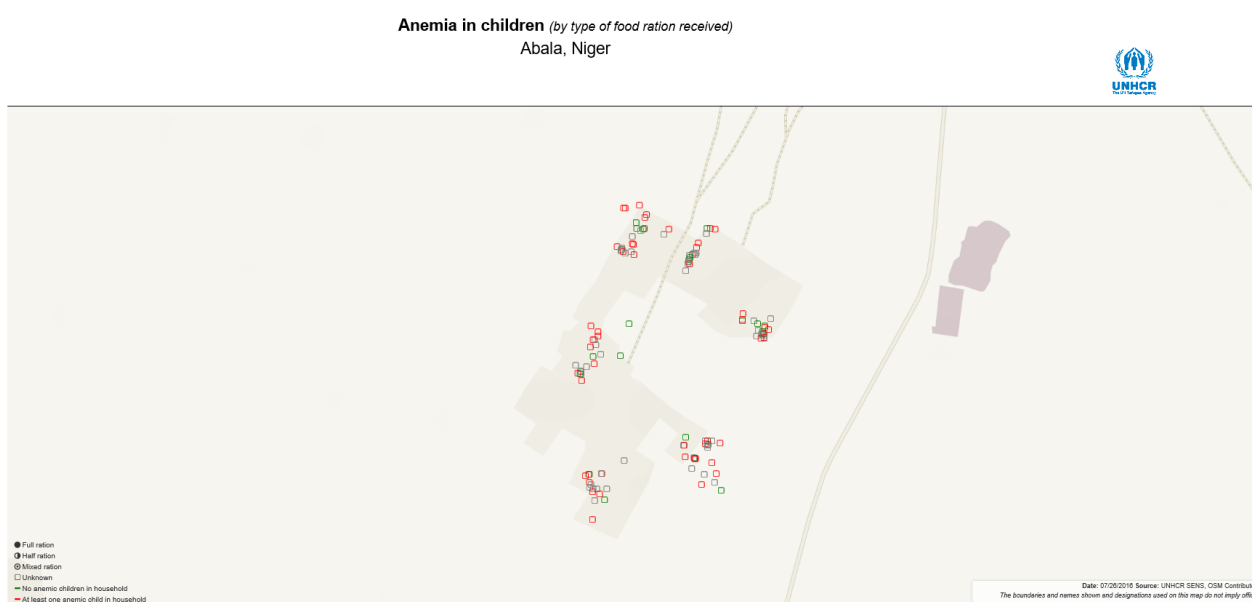
Figure 1: Cartographie de l'anémie des enfants lors de l'enquête SENS menée dans à Abala au Niger.

Vous trouverez ci-dessous un exemple du type de carte que l'on peut réaliser à partir des points GPS collectés :