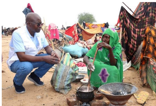
Magatte Guisse, nouveau Représentant du HCR en visite à la frontière à Adré, à l'est du Tchad, où près de 200 000 réfugiés vivent dans des abris de fortune et sont exposés aux intempéries.

La Commission nationale d'accueil de réinsertion des réfugiés et des rapatriés (CNARR), le HCR et les partenaires continuent les missions de suivi le long de la frontière dans les provinces du Ouaddaï, d'Ennedi Est et du Wadi Fira, en vue d'un éventuel afflux en raison des récentes violences à El Geneina au Soudan.