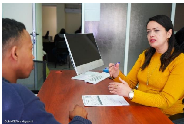
Sanaa, staff de l'Organisation Marocaine des Droits Humains qui enregistre un demandeur d'asile au centre de l'OMDH Oujda