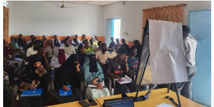
L'Agence Nationale pour l'Emploi, la Formation et l'Insertion Professionnelle (ANEFIP), en collaboration avec le HCR et ONARS forme 150 jeunes réfugiés à Ali-Addeh, Holl-Holl et Markazi