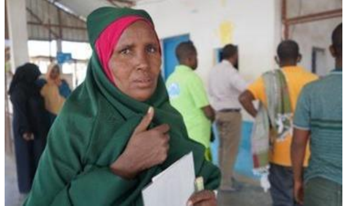
Une femme réfugiée avec ses documents légaux

Les agences des Nations Unies à Djibouti publie leur rapport annuel. Le 28 avril, les agences des Nations Unies à Djibouti ont présenté leur rapport annuel au ministre des Affaires étrangères et à d'autres partenaires. Ce rapport met en lumière les efforts et les progrès faits en vue de la réalisation des objectifs de développement durable et du programme 2030. Il présente les réalisations des différentes agences, avec les histoires à succès des réfugiés inclus. Des efforts louables ont été déployés dans la lutte contre les mutilations génitales et dans d'autres domaines tels que l'éducation, la création d'emplois pour les jeunes, la santé et la nutrition. Le gouvernement a également salué les excellentes relations entre l'ONU et le gouvernement.