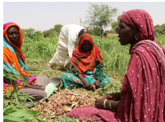
Récolte des légumes par les réfugiées et autochtones sur le site maraîcher de Lira.

Des conditions critiques perdurent dans les zones frontalières et les sites de réfugiés, tandis que l'afflux de Soudanais continue. La situation reste critique à Tiné, où environ 17 000 personnes sont toujours à la frontière dans des conditions extrêmement difficiles. Malgré l'allocation récente de 10 millions de dollars pour les interventions d'urgence et le renforcement des partenaires opérationnels, la réponse globale sur les sites de relocalisation reste largement en deçà des normes minimales. L'accès à l'eau potable demeure une préoccupation majeure. À Iridimi, par exemple, les réfugiés ne reçoivent que 2,8 litres d'eau par personne par jour. Deux défis opérationnels immédiats doivent être relevés avec le soutien des autorités : identifier de nouveaux sites de relocalisation pour décongestionner les zones surpeuplées et fournir des ressources logistiques et de transport supplémentaire pour accélérer les relocalisations.