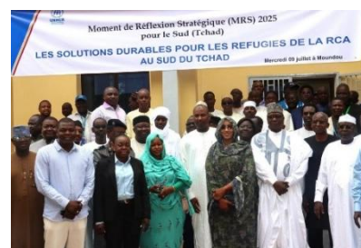
Moment de Réflexion Stratégique (MRS) 2025 pour le Sud (Tchad)

Le 9 juillet, le gouvernement tchadien, le HCR et ses partenaires ont organisé un atelier stratégique sur les solutions durables pour les réfugiés centrafricains dans le sud du pays, en prévision d'une réduction progressive de la présence du HCR dans la région. L'atelier visait à identifier des initiatives conjointes liant humanitaire, développement et paix, à explorer de nouvelles opportunités, promouvoir des approches innovantes et renforcer l'engagement des parties prenantes pour assurer la continuité et la durabilité de la réponse.