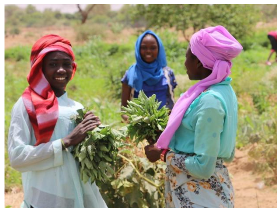
Récolte des légumes par les réfugiées et autochtones sur le site maraîcher de Lira.

Le HCR au Tchad lance un appel urgent pour la relocalisation des réfugiés soudanais et une assistance vitale dans l'est du Tchad. L'opération requiert de toute urgence 100 millions de dollars de financement flexible afin de répondre aux besoins humanitaires critiques, notamment la relocalisation immédiate de 239 000 réfugiés actuellement bloqués dans des zones frontalières surpeuplées et exposées à des risques sécuritaires. Ce financement permettra de relocaliser les réfugiés vers des sites et villages plus sûrs, où ils pourront bénéficier d'une protection renforcée et d'une assistance essentielle, incluant l'accès à l'eau, à l'assainissement et aux soins de santé. L'appel comprend 20,2 millions de dollars pour la relocalisation, 10,6 millions de dollars pour les services de protection et 68,8 millions de dollars pour les services de base dans les sites de relocalisation.