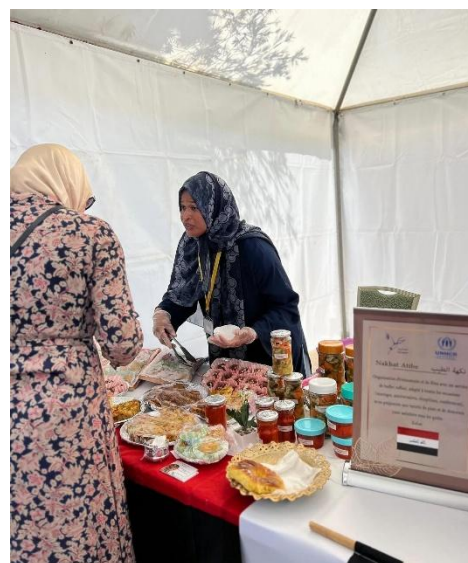
Des réfugié-e-s porteur-euse-s de projets ont pris part au festival culinaire organisé par le Cercle Diplomatique au Maroc, mettant en valeur leur culture à travers la cuisine.