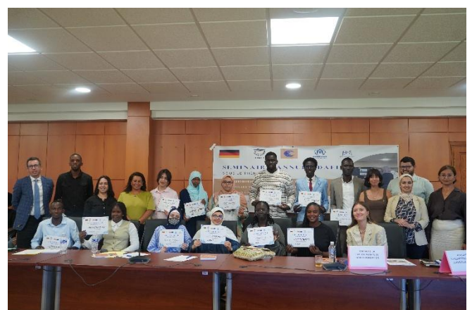
Séminaire DAFI 2025 : Cérémonie de remise des certificats aux lauréat-e-s des bourses DAFI.