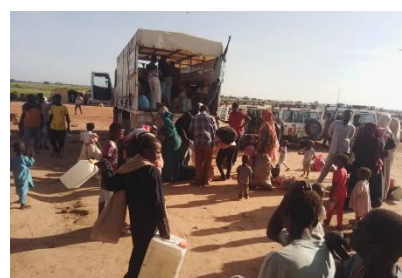
Accueil du convoi des nouveaux arrivants à Marrasabré, Tchad

Entre le 28 septembre et le 4 octobre 2025, le HCR et ses partenaires ont relocalisé 3 424 réfugiés soudanais (905 ménages) vers les sites de Marassabré, Kouchaguine Moura et Abougoudam. Dans le Wadi Fira, 728 ménages (3 113 personnes) ont été relocalisés d'Aringbote vers Marassabré. Dans le Ouaddaï, les relocalisations depuis Adré vers Kouchaguine Moura ont repris après une suspension de 10 jours due à une pénurie d'abris. À ce jour, 167 ménages (311 personnes) y sont installés dans 76 tentes familiales. Par ailleurs, 10 ménages ont été transférés d'Adré vers Abougoudam. Pour plus d'informations, consultez le tableau de bord actualisé de la relocalisation ici .