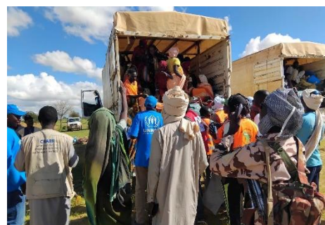
Accueil du convoi des nouveaux arrivants à Ibeida est du Tchad © UNHCR/Madjadoum Bolde.

Du 15 au 21 septembre, le HCR et ses partenaires ont facilité la relocalisation de 743 ménages de 2 704 réfugiés vers des sites aménagés. Parmi eux, 2 571 réfugiés ont été relocalisés depuis les sites spontanés d'Aringbote et de Korabo vers le nouveau site d'Ibeida, portant à 7 634 le nombre total de réfugiés (1 902 ménages) relocalisés vers ce site depuis le 29 août. Par ailleurs, à Adré, 133 réfugiés ont été transférés vers les sites d'Abougoudam et de Kouchaguine-Moura. Cependant, les déficits en infrastructures et en assistance, notamment dans le secteur des abris, continuent de représenter un défi pour les opérations de relocalisation. Le HCR et la CNARR coordonnent étroitement pour résoudre les interruptions temporaires et poursuivre les relocalisations.