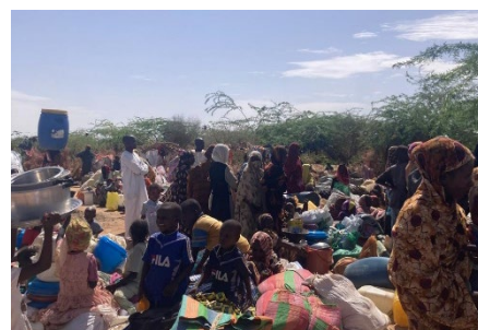
Relocalisation des nouveaux arrivants depuis le lit de la rivière Kariari vers le site aménagé d'Oure Cassoni, Ennedi-Est.