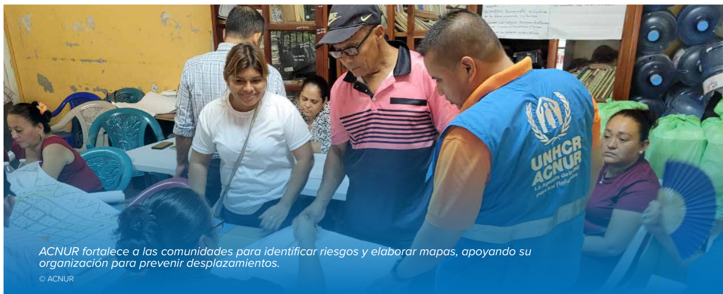
ACNUR fortalece a las comunidades para identificar riesgos y elaborar mapas, apoyando su organización para prevenir desplazamientos.

ACNUR también facilitó diálogos con líderes garífunas de seis comunidades en el departamento de Atlántida sobre acceso humanitario y riesgos de protección , destacando las vulnerabilidades acumuladas que enfrentan las comunidades afrodescendientes.