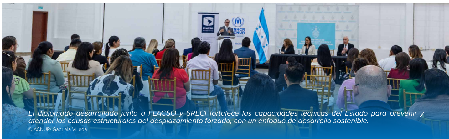
El diplomado desarrollado junto a FLACSO y SRECI fortalece las capacidades técnicas del Estado para prevenir y atender las causas estructurales del desplazamiento forzado, con un enfoque de desarrollo sostenible.

Estos esfuerzos subrayaron el papel catalizador y de convocatoria de ACNUR para unir a gobierno, sociedad civil y actores internacionales en el sostenimiento de respuestas colectivas y en la atención de los riesgos de desplazamiento forzado en Honduras.