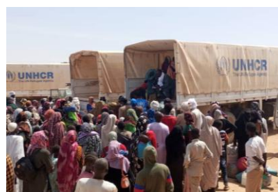
Embarquement des nouvelles arrivées d'Adré vers le site de Kouchaguine Moura