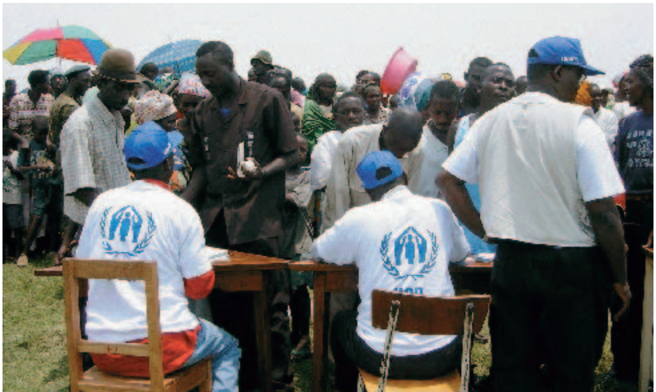
Centre d'enregistrement ouvert à l'intention des réfugiés congolais (RDC) à Gatumba.

Des efforts sont actuellement déployés pour renforcer l'octroi de l'assistance humanitaire, en coordination avec le Gouvernement, différentes institutions des Nations Unies, les donateurs et les pays concernés, ainsi qu'avec les ONG et organisations internationales intervenant dans les zones de retour. Une telle coordination est indispensable si l'on veut que la réinsertion des rapatriés soit durable. D'autres partenariats, noués avec