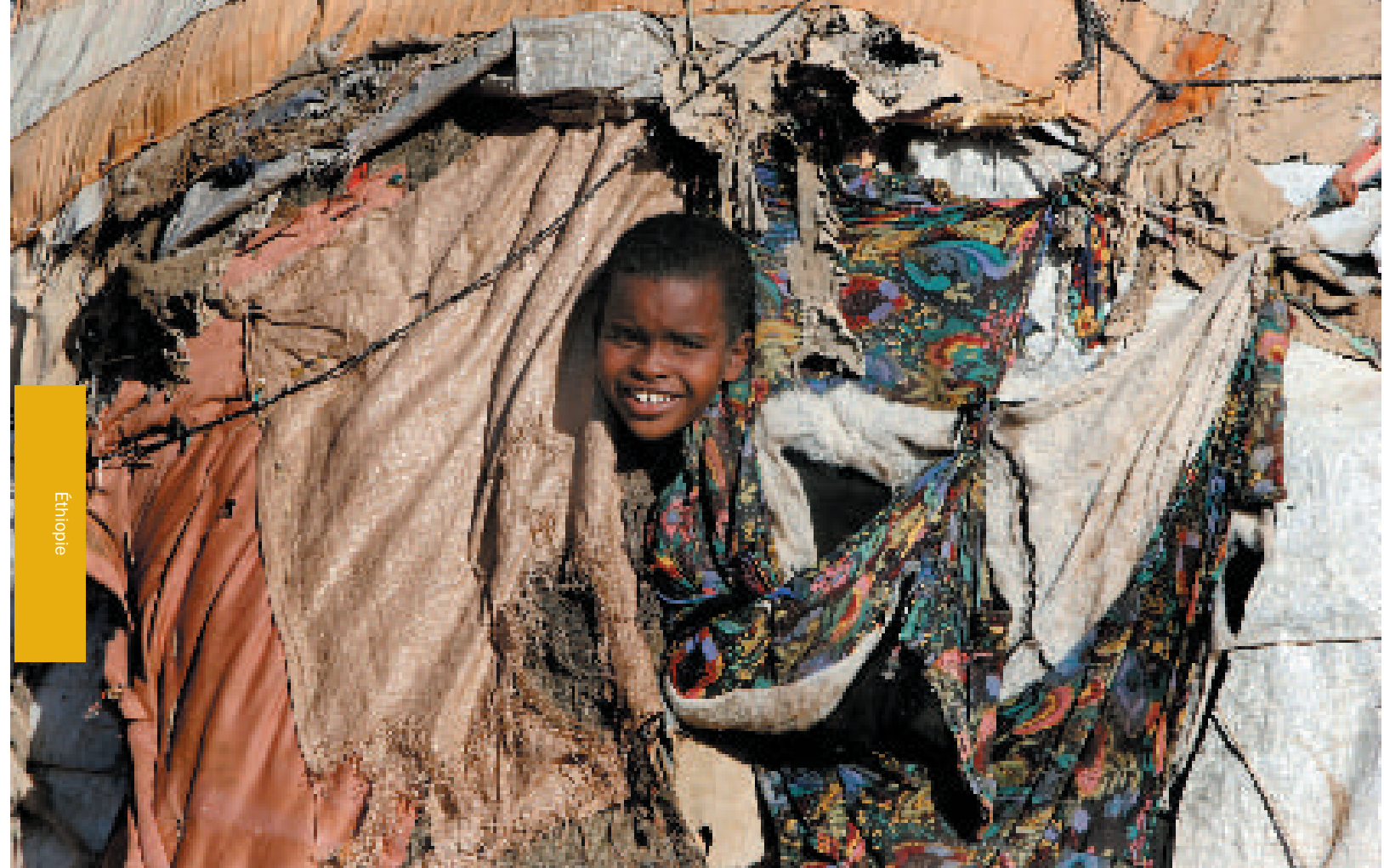
Au camp de réfugiés d'Aïsha, un jeune Somalien regarde ce qui se passe hors de sa tente.

Les efforts de réinstallation s'intensifieront, en particulier pour les personnes nécessitant une attention particulière en raison de leur vulnérabilité ou de problèmes de protection immédiats. Pour les autres réfugiés, l'UNHCR tentera d'obtenir un rapatriement librement consenti lorsque les conditions le permettront dans le pays de retour.