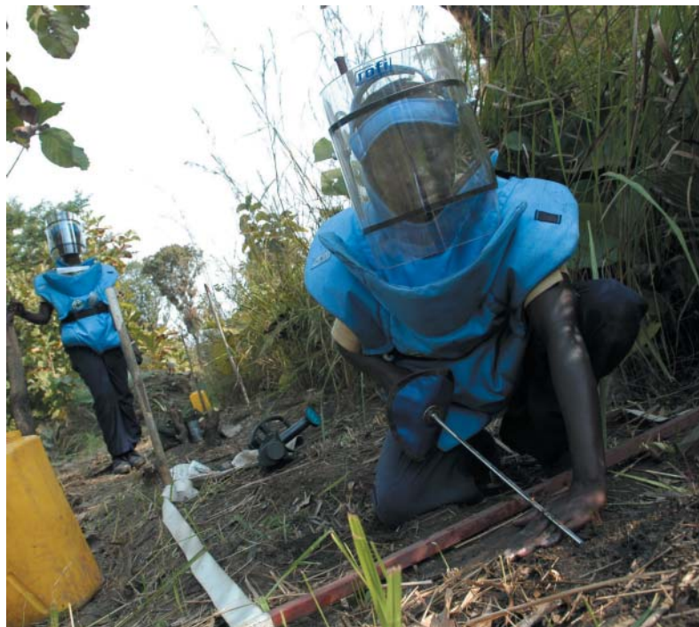
Sud-Soudan : des démineuses au travail dans une zone de plantation aux environs de Yei. Les bâtons blancs indiquent les passages exempts de mines où les membres de l'équipe peuvent marcher.

L'UNHCR mènera certaines activités de protection, consistant notamment à s'assurer du caractère volontaire des retours avant les départs, à préserver l'unité des familles pendant le processus de retour, à fournir aux déplacés internes des informations très récentes sur les conditions de vie