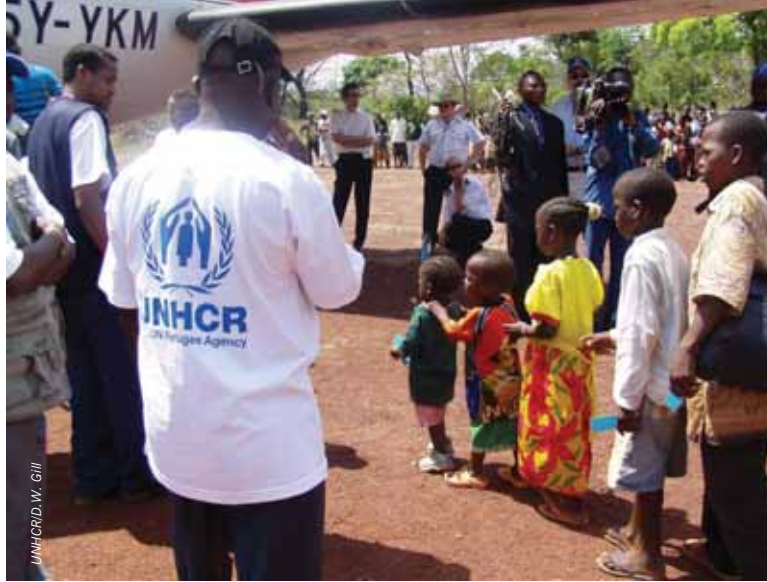
A Mboki, des réfugiés du Sud-Soudan s'apprentent à prendre l'avion qui les ramènera chez eux.

Services communautaires : l'UNHCR a dispensé une aide financière et une formation professionnelle aux réfugiés urbains, en accordant la priorité aux femmes célibataires. Plus d'une centaine de jeunes réfugiés, suivant des études secondaires ou supérieures, ont bénéficié d'une assistance financière. Au titre d'une stratégie visant à aider les enfants de réfugiés urbains scolarisés dans le primaire en 2006-2007, l'UNHCR a fourni du matériel scolaire et participé aux frais d'inscription et d'examen.