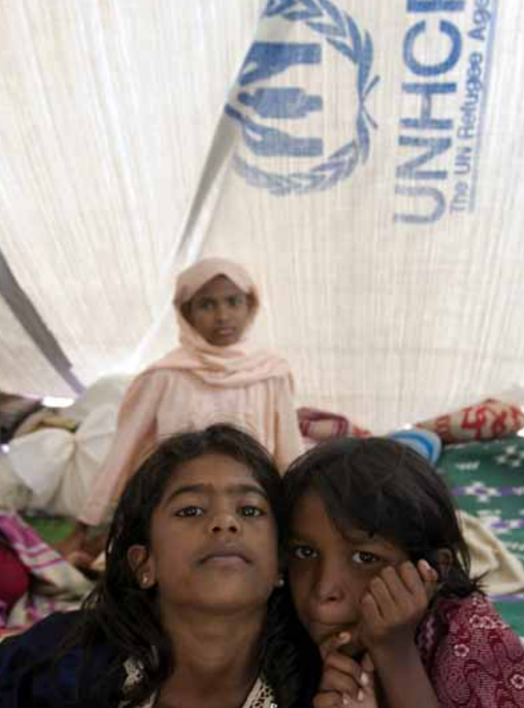
Sri Lanka. Enfants déplacés sous une tente fabriquée à partir d'une bâche de l'UNHCR à Kantale.