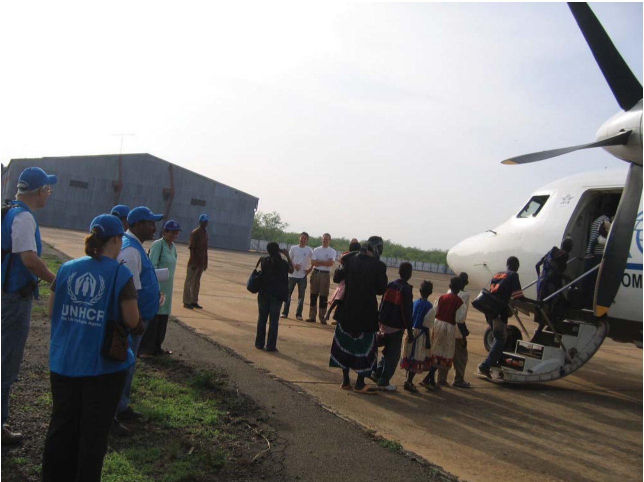
HCR/K.G. - Egziabêr

Le pont aérien organisé dans le cadre de l'opération de rapatriement librement consenti de l'Éthiopie au Sud-Soudan a commencé au milieu du mois d'avril 2007.