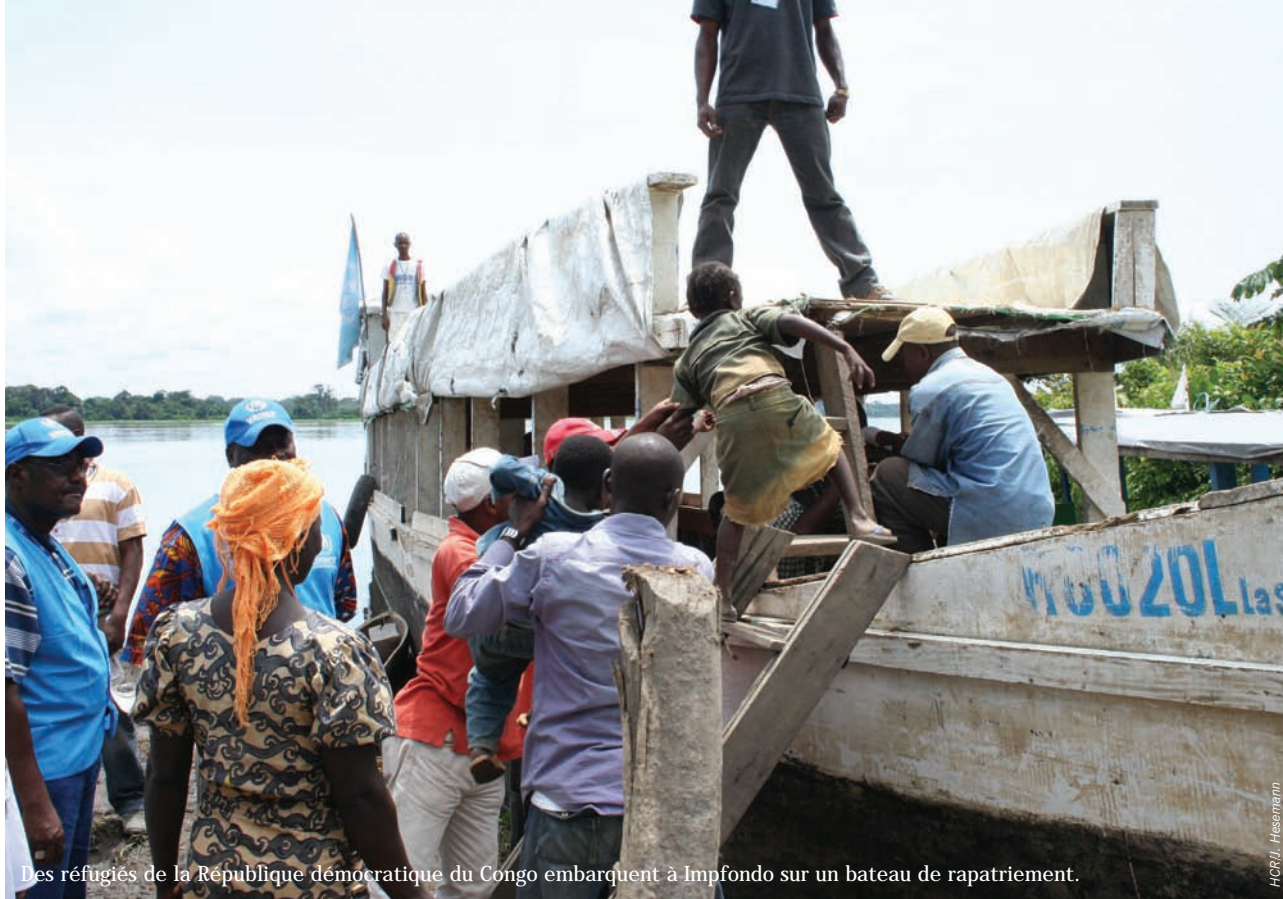
Des réfugiés de la République démocratique du Congo embarquent à Impfondo sur un bateau de rapatriement.