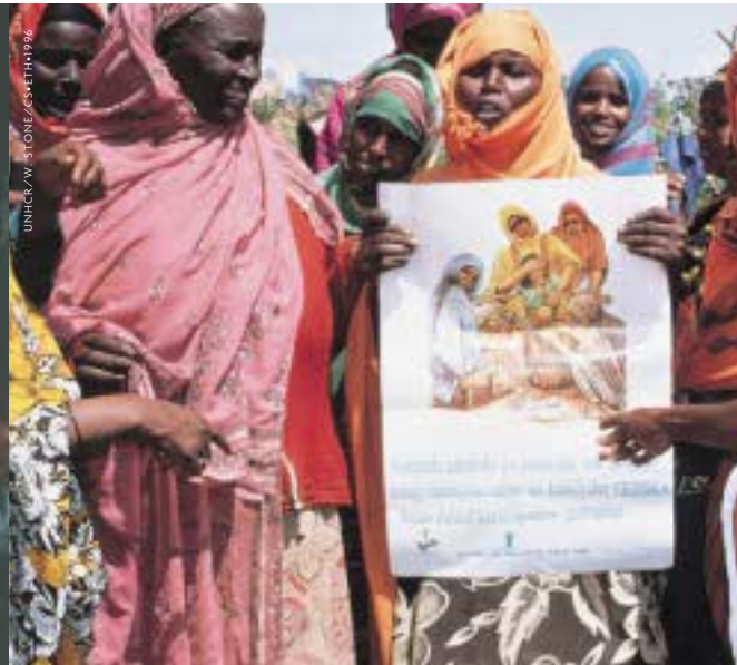
L'éducation est souvent la clé d'un avenir plus souriant. Jeunes rapatriées dans une école du Myanmar. Lutte contre les mutilations génitales en Éthiopie.