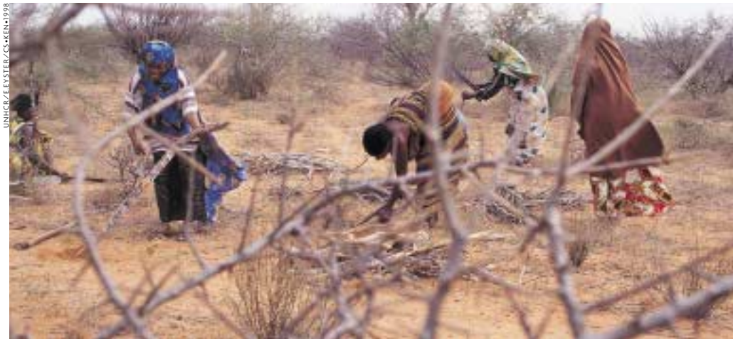
S'aventurer hors du camp pour aller chercher du bois exposait les réfugiées somaliennes au Kenya à de multiples dangers.