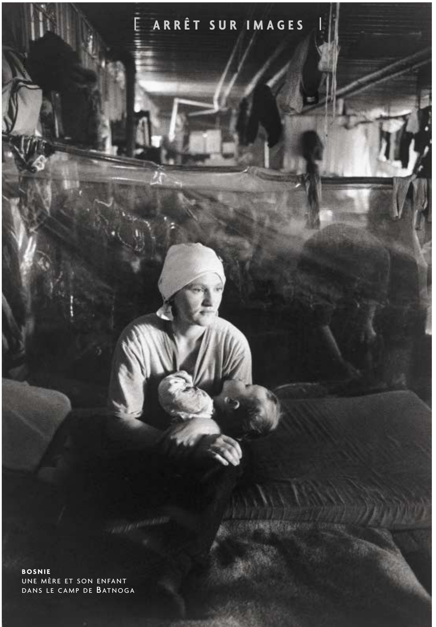
BOSNIE UNE MÈRE ET SON ENFANT DANS LE CAMP DE BATNOGA