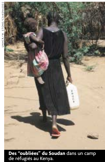
Des "oubliées" du Soudan dans un camp de réfugiés au Kenya.