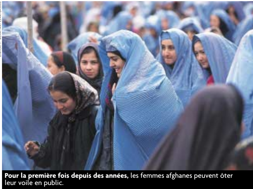
Pour la première fois depuis des années, les femmes afghanes peuvent ôter leur voile en public.

En écho aux propos du responsable surmené en Guinée, un professionnel chargé de