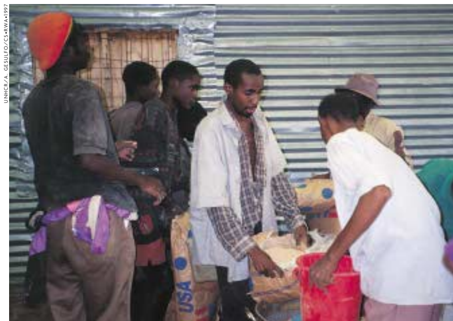
Dans le passé, la distribution de nourriture était souvent supervisée par des hommes et les femmes n'étaient pas toujours les mieux servies.

Au début du nouveau millénaire, une résolution de l'ONU engageait les gouvernements à protéger les femmes des violences et abus commis en temps de guerre et à les inclure dans les négociations de paix ultérieures. Une déclaration du Conseil de sécurité venait