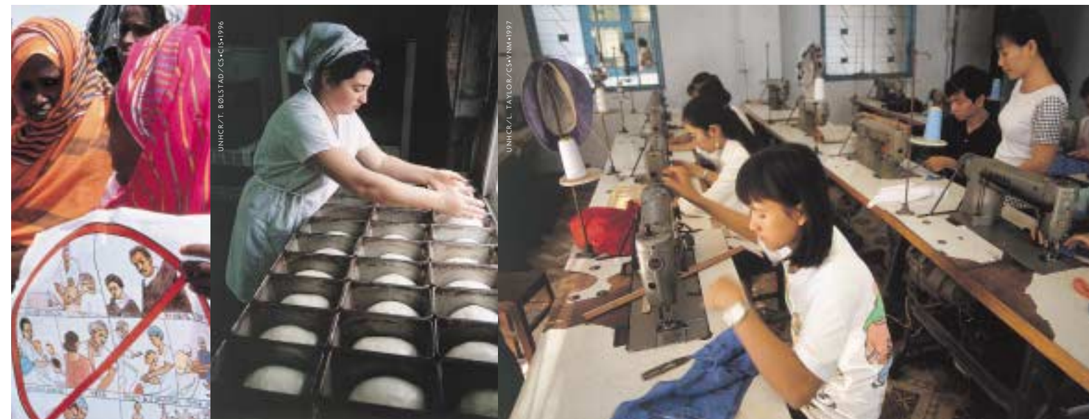
La formation permet aux femmes réfugiées de trouver du travail lorsqu'elles retournent dans leur pays – que ce soit dans une boulangerie en Tchétchénie ou dans une usine de textiles à Hô Chi Minh-Ville, au Viet Nam.

“SI VOUS CHERCHEZ DES LEADERS, PENSEZ À NOUS. CE N’EST PAS PARCE QU’ELLES PORTENT UN VOILE QUE LES FEMMES N’ONT PAS DE VOIX. LA DOMINATION DES HOMMES N’A APPORTÉ QUE GUERRES ET SOUFFRANCES.”