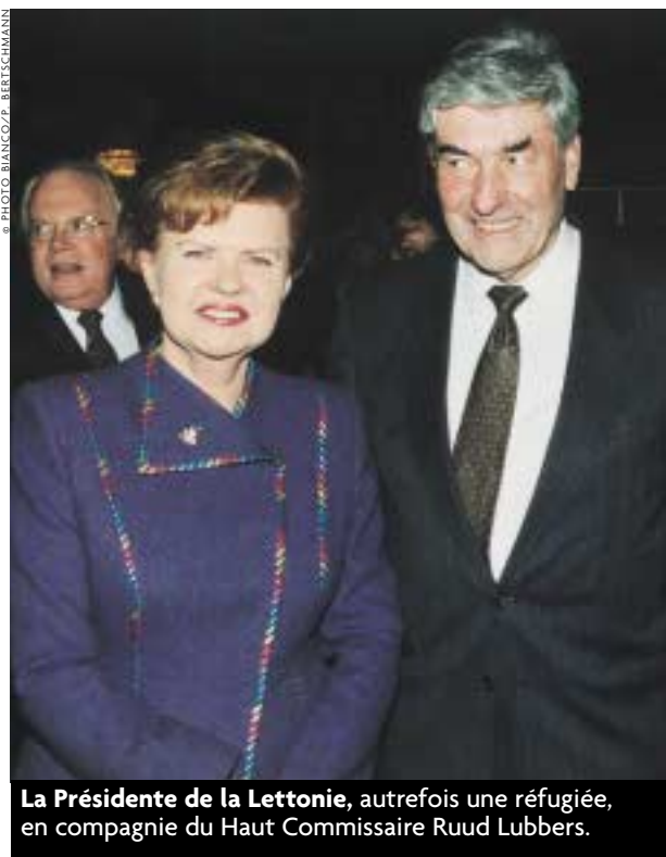
La Présidente de la Lettonie, autrefois une réfugiée, en compagnie du Haut Commissaire Ruud Lubbers.

Elle aurait pu connaître les trains de déportation soviétiques. Elle est devenue chef d'Etat.