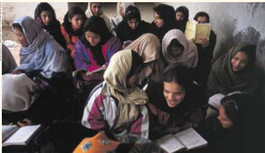
L'arrivée d'un nouveau gouvernement à Kaboul a permis la réouverture des écoles.

Les auteurs travaillent pour l'association humanitaire américaine Refugees International.