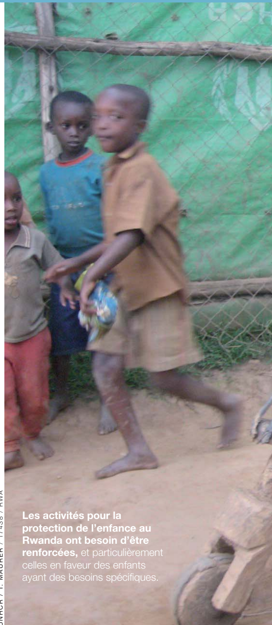
Les activités pour la protection de l'enfance au Rwanda ont besoin d'être renforcées, et particulièrement celles en faveur des enfants ayant des besoins spécifiques.

LA CONCURRENCE ENTRE LES RÉFUGIÉS ET LA POPULATION locale pour le partage des rares ressources, en particulier l'abattage illégal des arbres et l'absence de bois de chauffage, nourrit les tensions et provoque des incidents sécuritaires. Les femmes