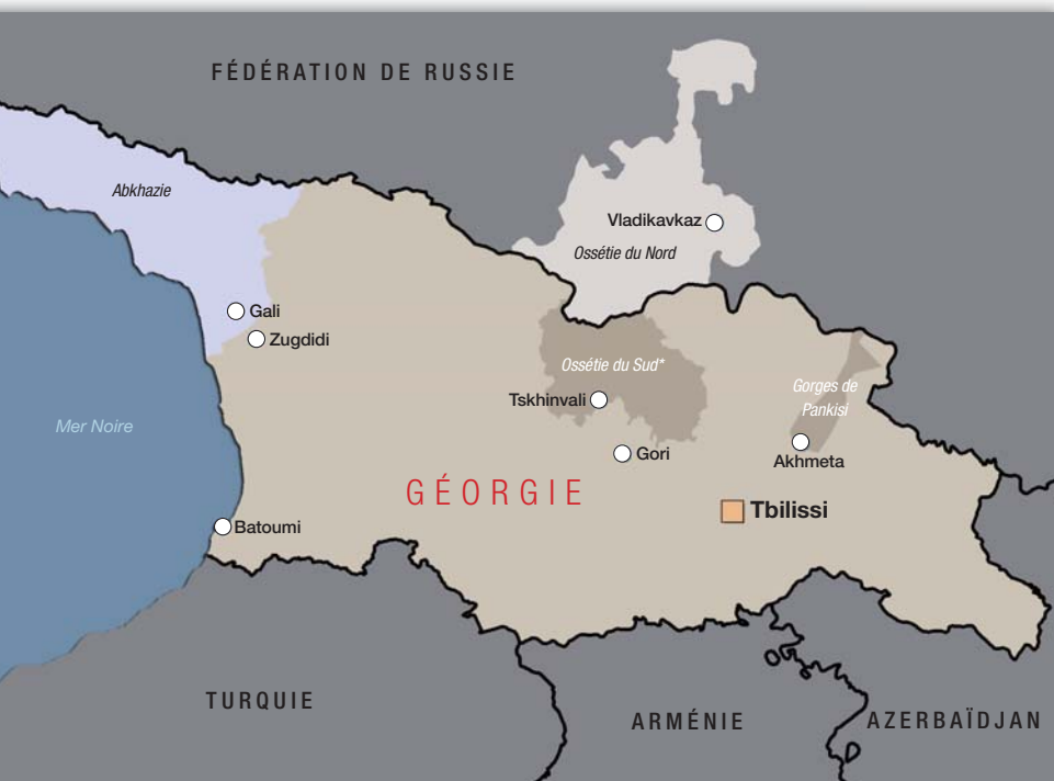
* Région séparatiste d'Ossétie du Sud

d'accès aux services sociaux et de faibles taux de scolarisation des enfants. La sécurité alimentaire est un problème reconnu mais il n'existe pas de chiffres précis sur les taux de malnutrition. Le modeste dispositif d'allocation d'aide en espèces par le HCR ne peut pas totalement faire face à ce problème, lequel est exacerbé par les moyens limités pour l'autonomie des réfugiés. Les conditions de vie dans les centres collectifs dans la vallée de Pankisi sont souvent déplorable, avec un manque d'électricité, d'eau, de toitures, de fenêtres et de portes adéquates. A Tbilissi, les réfugiés louent ou vivent dans des bâtiments dont la construction n'est pas terminée et qui ne répondent pas au niveau de vie minimal acceptable. Exclue de l'assurance santé nationale ou des soins de santé gratuits, les réfugiés dépendent des ONG pour l'aide médicale, mais celle-ci ne suffit pas pour satisfaire leurs besoins. Les taux de scolarisation des enfants réfugiés sont faibles pour un certain nombre de raisons, notamment les coûts liés à l'éducation, à l'éloignement de certains foyers et aux perceptions traditionnelles de la valeur de l'éducation pour les filles. Les certificats délivrés par les écoles fréquentées par les réfugiés ne sont souvent pas reconnus par les institutions publiques, ce qui limite les possibilités de faire des études supérieures ou de trouver un emploi.