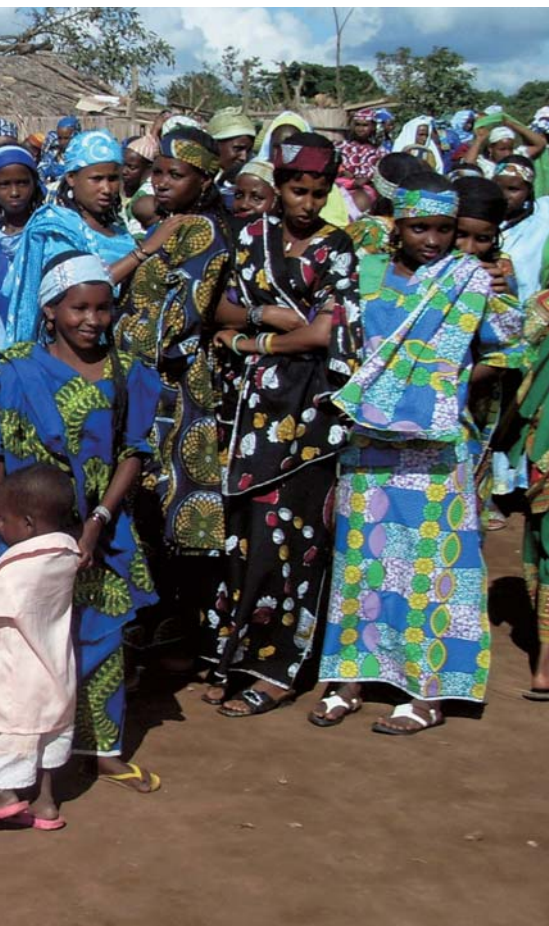
La République centrafricaine font des récits poignants de leurs bandits contre d'énormes rançons.

■ Législation nationale : juillet 2005, loi adoptée sur la protection des réfugiés, décret pas encore signé