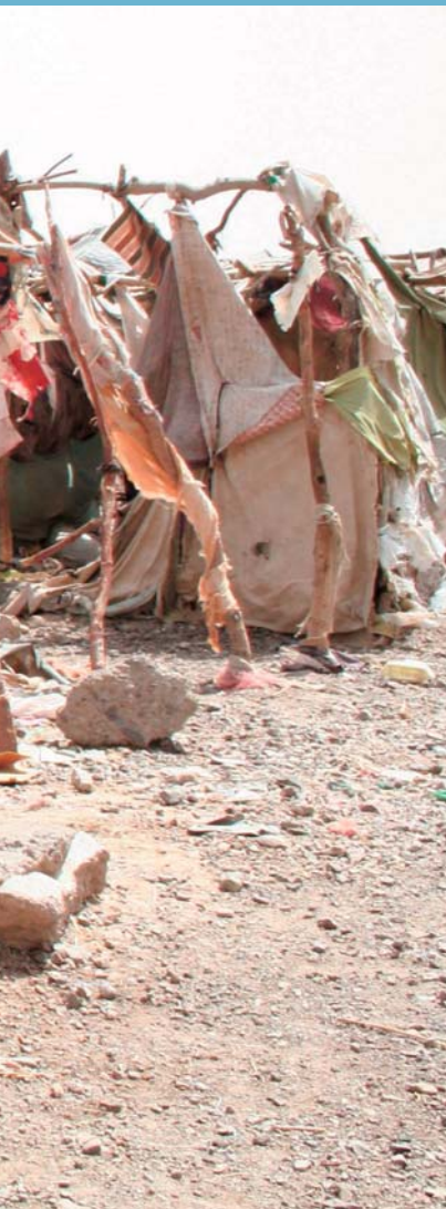
UNHCR / J. BJÖRGVINSSON / 16942 / YEM

■ Législation nationale: aucun instrument législatif