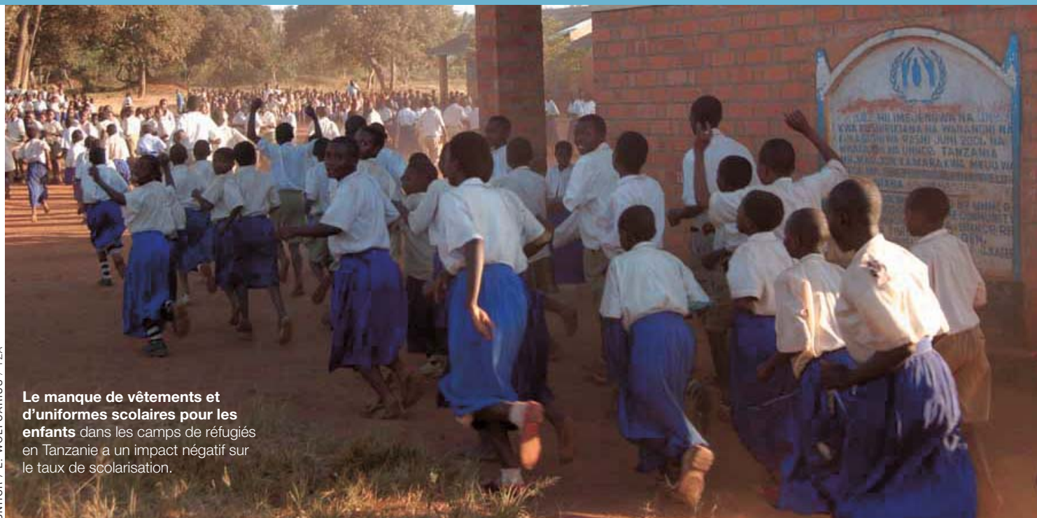
Le manque de vêtements et d'uniformes scolaires pour les enfants dans les camps de réfugiés en Tanzanie a un impact négatif sur le taux de scolarisation.

■ Législation nationale: Loi tanzanienne de 1998 relative aux réfugiés