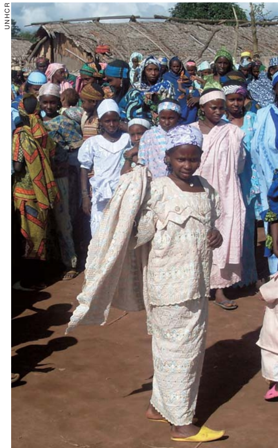
Des réfugiés nomades mbororos originaires de République centrafricaine, y compris l'enlèvement de leurs enfants par de

fillettes peuvent être exposées à l'exploitation sexuelle et à d'autres abus. La situation économique fragile de nombreuses familles réfugiées accroît la violence domestique. Un programme de prévention et de réponse à la violence sexuelle et sexiste, lancé par le HCR en 2007 avec le soutien d'une ONG spécialisée, doit être développé en renforçant les mécanismes de réponse ainsi que les campagnes de sensibilisation et d'information. Un accent particulier devrait être mis