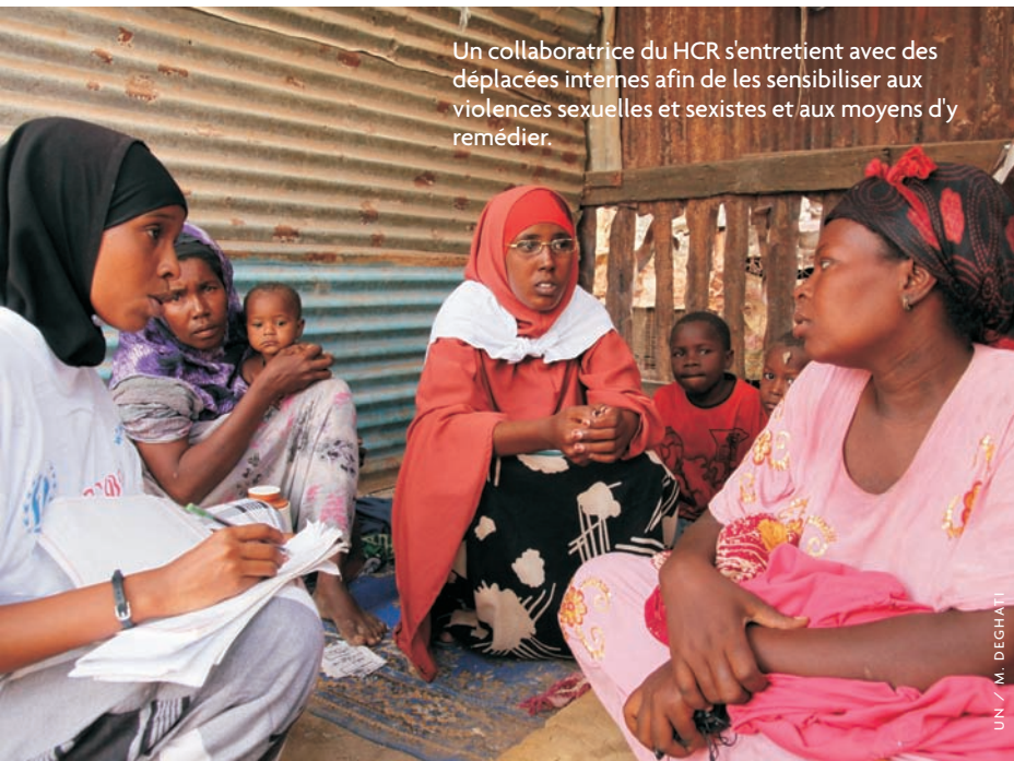
Un collaboratrice du HCR s'entretient avec des déplacées internes afin de les sensibiliser aux violences sexuelles et sexistes et aux moyens d'y remédier.