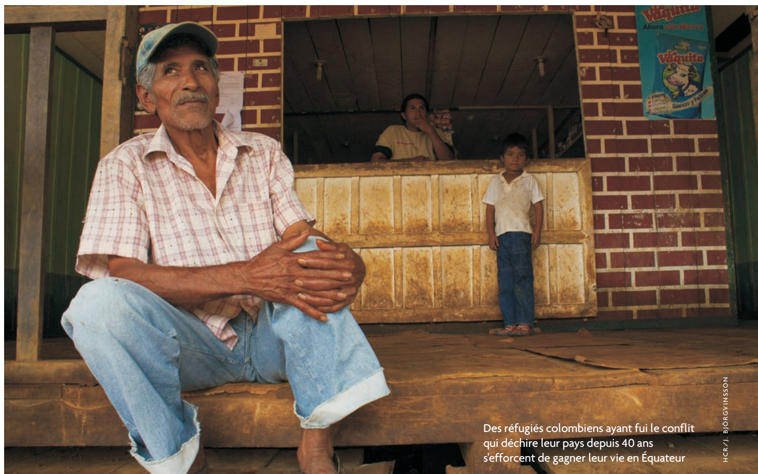
Des réfugiés colombiens ayant fui le conflit qui déchire leur pays depuis 40 ans s'efforcent de gagner leur vie en Équateur