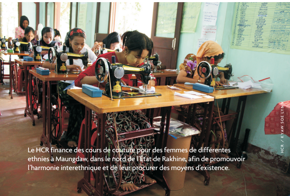
Le HCR finance des cours de couture pour des femmes de différentes ethnies à Maungdaw, dans le nord de l'État de Rakhine, afin de promouvoir l'harmonie interethnique et de leur procurer des moyens d'existence.