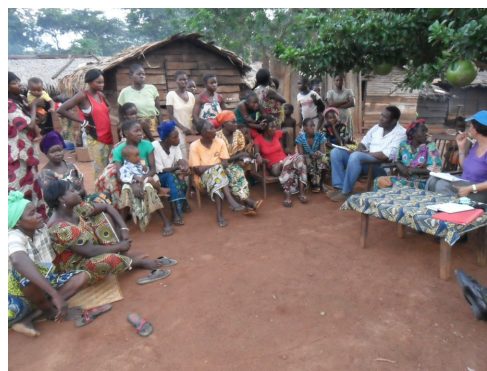
Discussions avec la communauté hôte de Batalimo dans le cadre de l'atelier participatif.