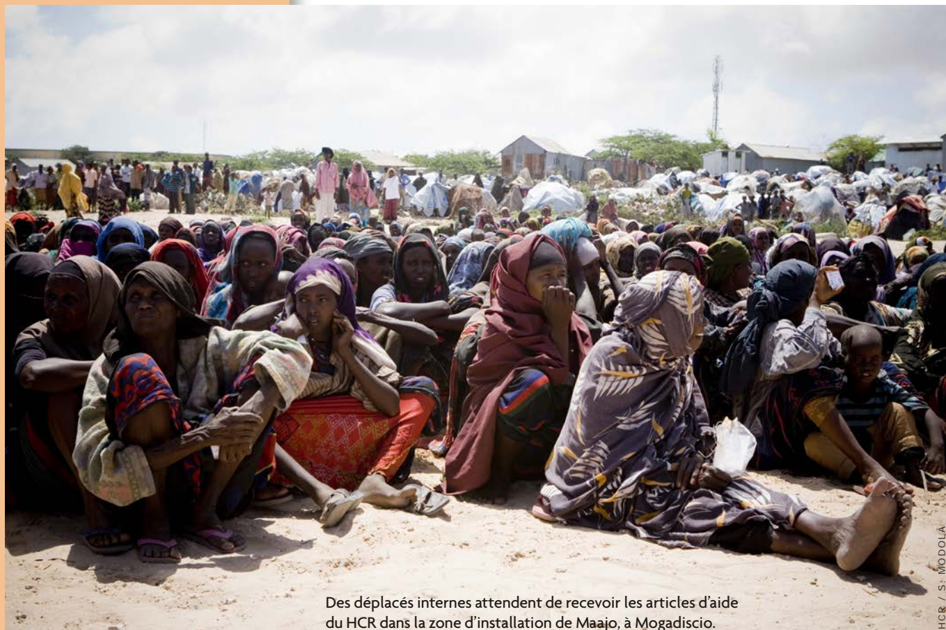
Des déplacés internes attendent de recevoir les articles d'aide du HCR dans la zone d'installation de Maajo, à Mogadiscio.

Bien que les forces antigouvernementales aient été délogées des grandes agglomérations, les conditions de sécurité restent précaires et l'accès humanitaire est