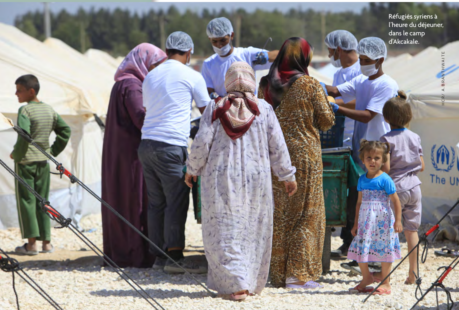
Réfugiés syriens à l'heure du déjeuner, dans le camp d'Akkakale.

La rédaction de la première loi sur l'asile, qui a été présentée au Parlement en 2012, témoigne de la volonté de la Turquie de respecter les normes internationales dans les questions relatives aux réfugiés. Cette loi devrait