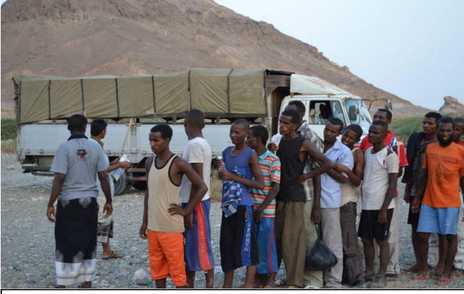
عدد من الواصلون الجدد يستعدون لترحيلهم إلى مراكز الاستقبال التابعة لمفوضية اللاجئين