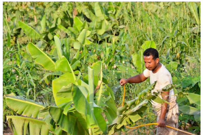
رجل يروي الموز بعد عودته إلى أبين، معظم المحاصيل في هذه المزرعة قد تم تدميرها خلال النزاع الذي بدأ في عام 2011.

عقد مكتب المفوضية في صنعاء دورة تشيئية لشركائها التنفيذيين حول السن والنوع الإجتماعي والتنوع و تقييمات تشاركية للأطفال. وأشتملت العملية على 9 مجموعات نقاش محورية مع الأطفال لتقييم احتياجاتهم ومراجعة الحلول المقترحة وتحديد الثغرات في نظام حماية الطفل. كما وحضرت المفوضية أيضاً اجتماعاً مع وزارة الشؤون الاجتماعية والعمل وقامت بإطلاع الوزارة على نتائج التقييم السريع لحماية الطفل الذي قامت به عدد من الوكالات التي أجرت هذا العمل في ست محافظات في الجنوب وكذلك محافظة حجة.