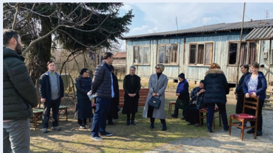
Visite du Défenseur public aux PDI dans le village de Shamgona

Le BDP de Géorgie, créé en 1996, s'est forgé une solide expertise dans la promotion et la protection des droits de l'Homme des PDI dans les zones touchées par le conflit. Il reçoit et enquête sur un grand nombre de plaintes liées au déplacement interne. Les représentants régionaux du BDP de Géorgie surveillent activement la situation des PDI dans les anciens camps de déplacés et leur apportent une assistance juridique. Les représentants du BDP communiquent des informations sur les problèmes identifiés lors des visites dans le cadre de leur compétence et coopèrent avec le gouvernement local pour y remédier. Le BDP de Géorgie consacre également un chapitre spécifique de son rapport parlementaire annuel aux droits des PDI.