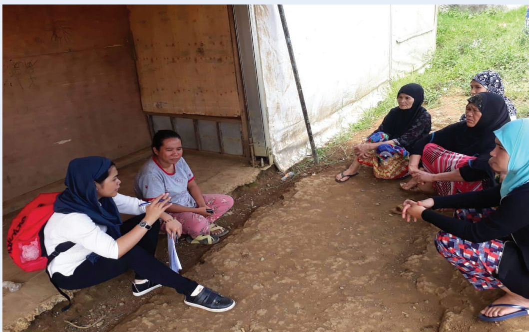
Entretien avec des cheffes de PDI sur un site d'évacuation dans la ville de Marawi, mai 2019

Aux Philippines , la Commission des droits de l'Homme a établi un Bureau régional basé dans la région autonome en Mindanao musulmane (ARMM) touchée par le conflit. Le Bureau régional de la CHR-ARMM était un bon exemple de la façon dont la décentralisation des fonctions liées aux PDI, telles que le suivi des PDI, peut s'avérer particulièrement utile dans les cas où une région du pays mérite un travail de protection des PDI plus intensif que d'autres.