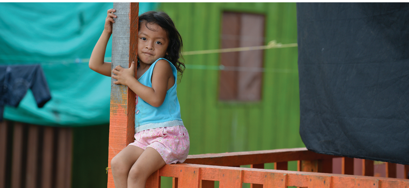
Una niña de cinco años juega en el exterior de la vivienda familiar en un asentamiento para personas desplazadas en Caquetá, Colombia (2013).