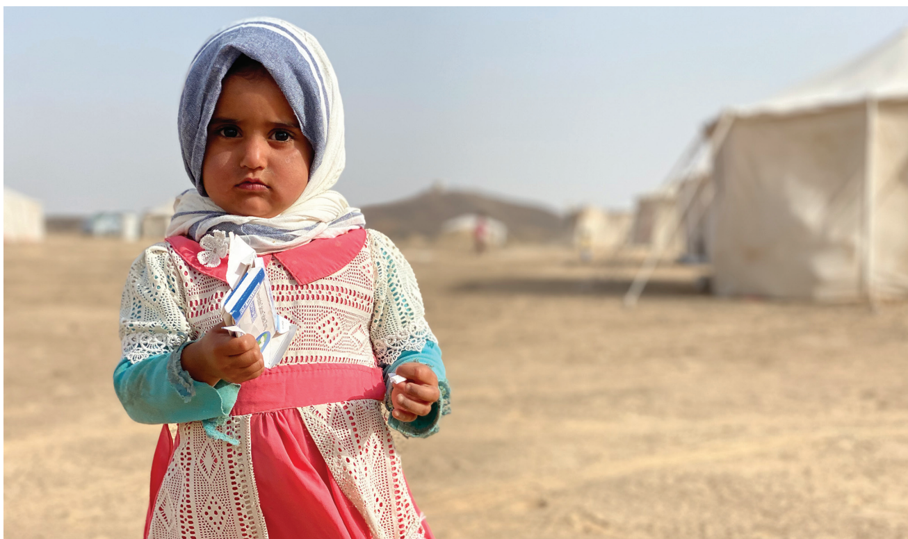
Une fillette yéménite de deux ans, déplacée par le conflit à Al Jawf, sur le site d'accueil des PDI à Marib, au Yémen (2020).

En 2019, la Commission a organisé une « journée de prestation de services mobiles » en collaboration avec les autorités gouvernementales compétentes, dans le but de faciliter les interactions en face à face entre les communautés et les prestataires de services. La Commission a utilisé des prospectus et différents supports pour annoncer l'événement. Parmi les institutions publiques invitées figuraient le Secrétaire divisionnaire, des femmes chargées du développement, des agents fonciers, des agents de probation, le greffier, la police, des agents de santé, des agents du travail, des agents de l'aide juridique et des acteurs du secteur de la pêche. Cela représentait pour les autorités l'occasion d'identifier et d'entreprendre des mesures immédiates, à moyen et à long terme pour résoudre les problèmes prolongés auxquels sont confrontés les PDI et les rapatriés, que la Commission des droits de l'Homme a continué de surveiller.