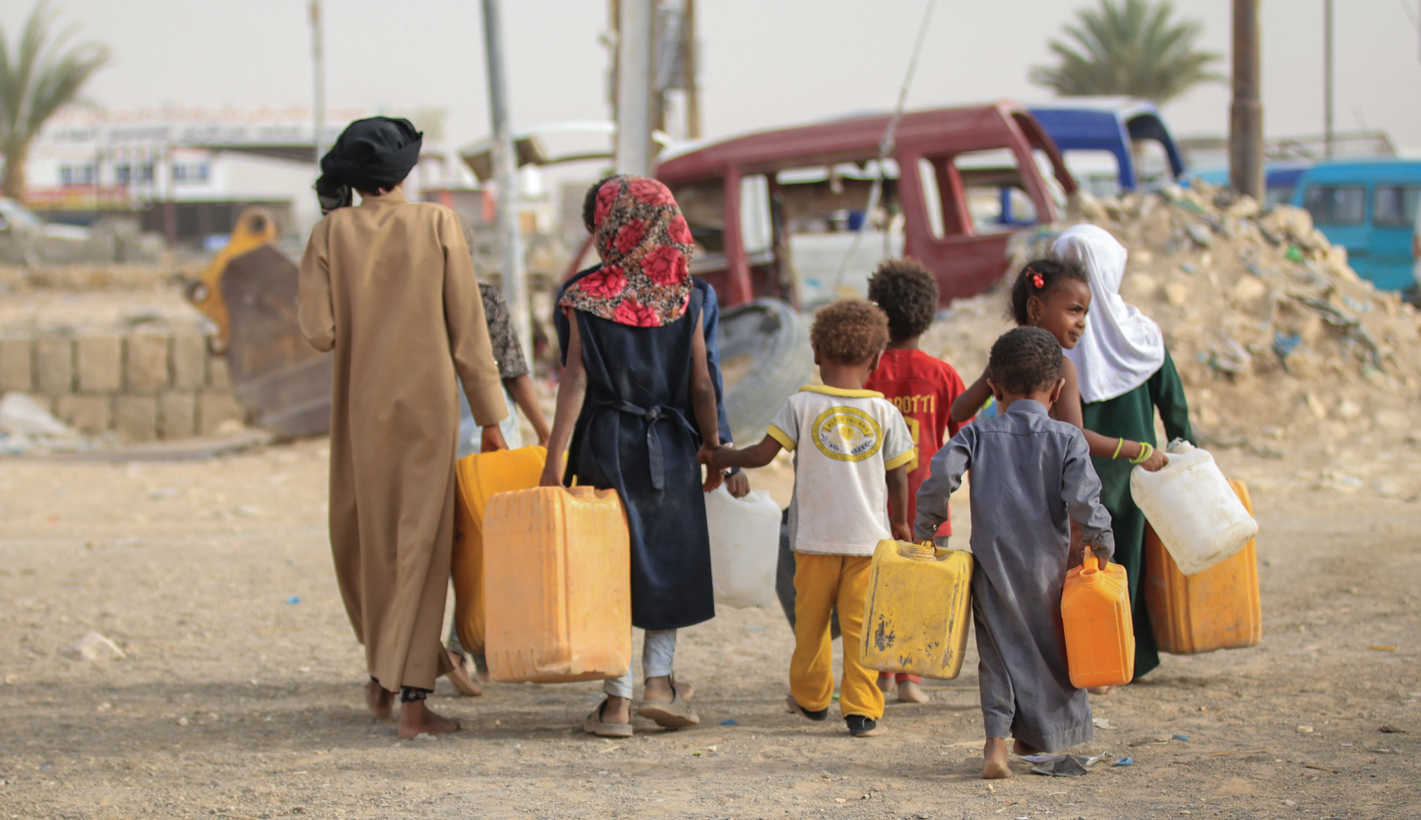
Enfants déplacés allant faire le plein d'eau au point de distribution d'eau du camp d'Al-Rawdah à Marib, au Yémen (2021).