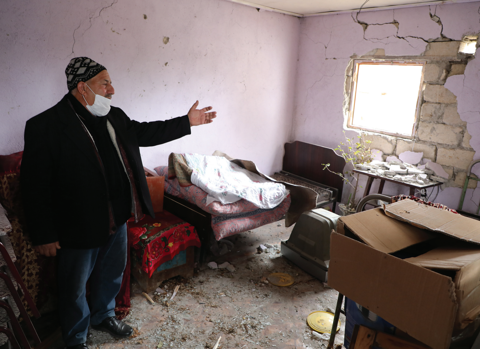
Un azerbaïdjanais de 66 ans a été déplacé du camp de Banovshalar dans la circonscription d'Agdam, près du territoire contesté du Haut-Karabakh (2020).