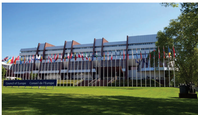
Palais de l'Europe.

De plus, tout en approuvant les Principes directeurs, le Comité des Ministres du CdE a reconnu que les PDI « ont des besoins particuliers en raison de leur déplacement » et a élaboré un ensemble de 13 principes pour guider les États membres « lors de la formulation de leur législation et de leurs pratiques internes » afin de veiller à ce qu'ils traitent efficacement le déplacement interne. 94 De même, dans une recommandation récente – bien que n'étant pas spécifiquement axée sur les PDI – le Comité des Ministres a souligné le « grand potentiel et l'impact des INDH indépendantes pour la promotion et la protection des droits de l'Homme en Europe » et a soumis une série de recommandations sur la création et le renforcement des INDH tout en garantissant et en instaurant un environnement sûr et favorable, ainsi qu'en promouvant la coopération et le soutien aux INDH. 95 Dans le même ordre d'idées, l'Assemblée parlementaire du Conseil de l'Europe (APCE) a adopté diverses recommandations et résolutions soulignant, entre autres, la nécessité d'une « assistance internationale continue aux PDI » et le rôle important que les INDH peuvent jouer dans le suivi et la protection des droits des PDI. 96