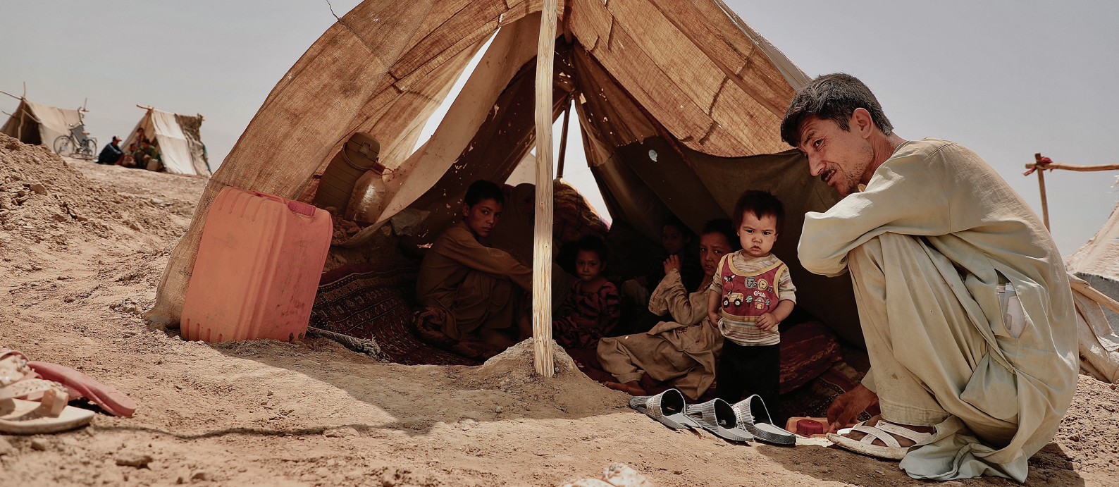
Des familles déplacées par le conflit en Afghanistan sont contraintes de vivre dans des tentes de fortune dans le camp de Bricade (2021).