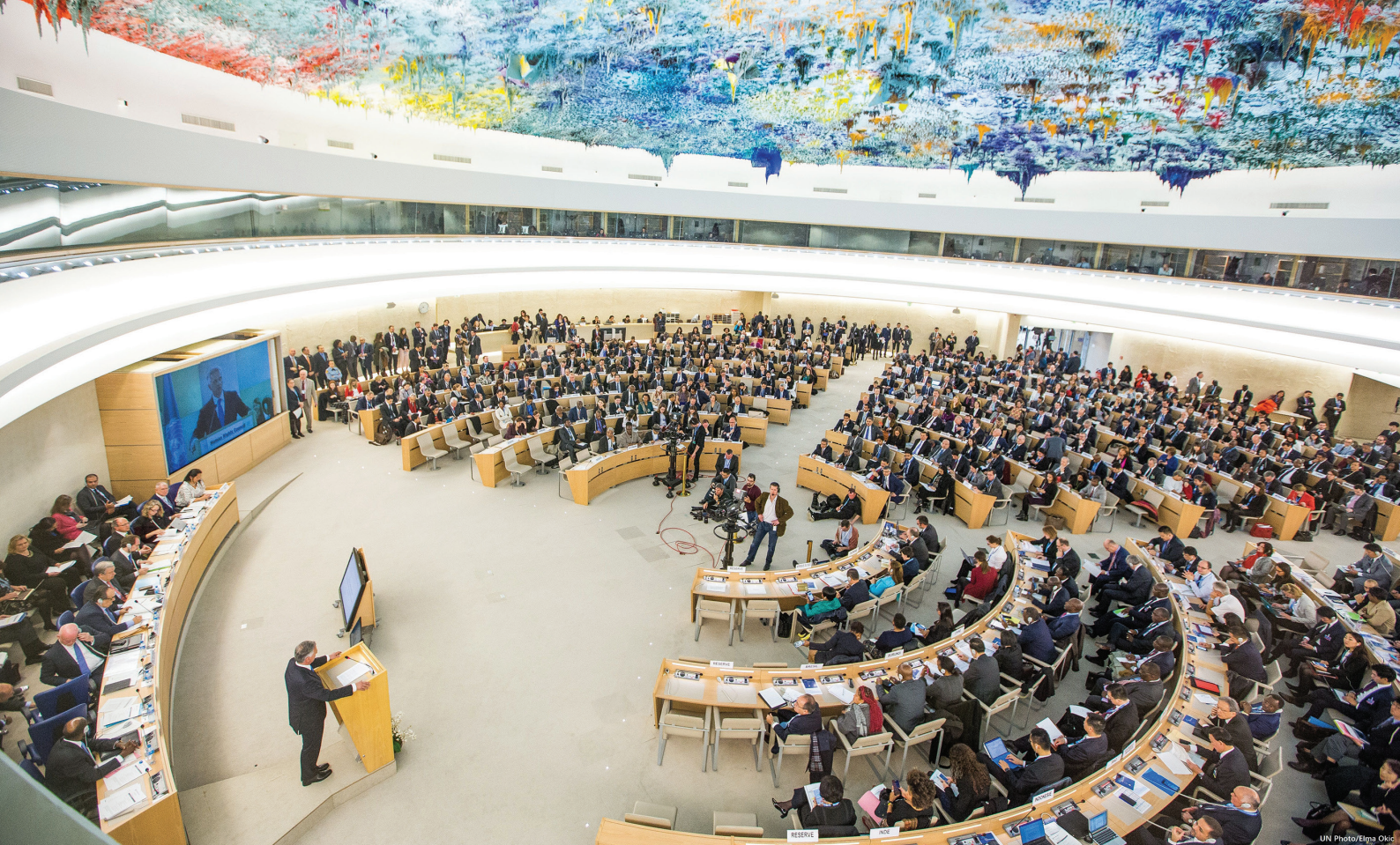
Conseil des droits de l'Homme de l'ONU.