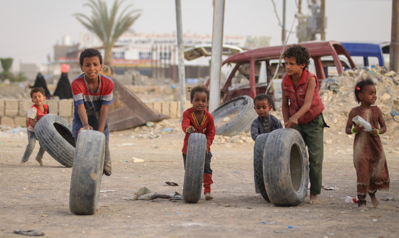
Des enfants déplacés jouent avec des pneus dans le camp d'Al-Rawdah à Marib, au Yémen (2021).