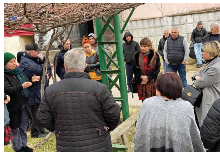
Réunion du Défenseur public avec des PDI vivant à Poti en février 2020.

Par exemple, en Géorgie , en 2013, le Bureau du Défenseur public (BDP) et plusieurs OSC et organisations internationales ont mené un travail de surveillance conjoint pour évaluer le respect des droits de l'Homme par un processus d'enregistrement renouvelé à l'échelle nationale pour les PDI mené par l'État. Ce suivi a permis à l'INDH de recueillir des informations détaillées sur la situation des PDI, d'identifier les lacunes dans la législation et la pratique, et de conseiller les organes de l'État sur les mesures requises. Le BDP a également mis au point de solides systèmes de suivi de la situation du logement des PDI, soumettant des recommandations régulières par le biais de rapports annuels et spéciaux aux organes de l'État sur les logements dangereux, et conseillant les décideurs sur la réinstallation des PDI dans le cadre du programme de solutions de logement durable. 47