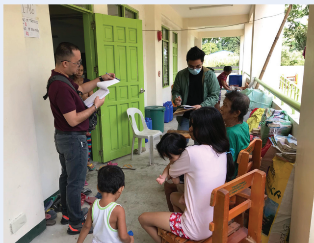
Entretiens avec des familles de PDI touchées par l'éruption du volcan Taal dans un site d'évacuation à Balayan, Batangas, Philippines, février 2020

Le pays des Philippines a été touché par des déplacements internes récurrents dus à diverses causes, notamment des catastrophes résultant d'aléas naturels, des conflits et des projets de développement à grande échelle. Dans ce contexte, la Commission des droits de l'Homme des Philippines (CHRP), dont le vaste mandat consiste à protéger et à promouvoir les droits de l'Homme, 49 a travaillé en étroite collaboration avec le HCR pour lutter contre le déplacement interne, notamment grâce à la mise en place d'un projet commun relatif aux PDI. Un résultat concret de ce projet a été l'élaboration d'un « Outil de suivi des déplacements des PDI » ainsi que le guide de l'utilisateur qui l'accompagne 50 et le Guide d'entretien pour aider le personnel de terrain à collecter et analyser les données. Les utilisateurs cibles de l'outil sont le personnel et les partenaires de la CHRP qui se joignent aux missions de suivi pour vérifier la situation des PDI sur le terrain.