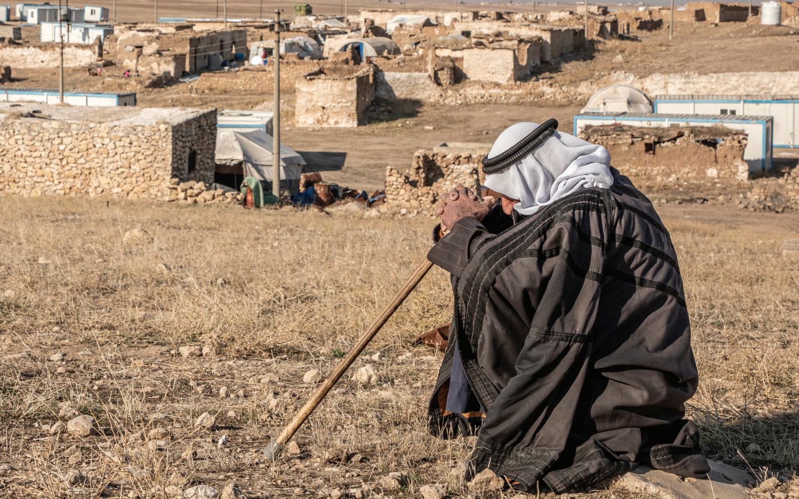
Un rapatrié âgé est assis près de sa maison détruite dans un village reculé de la province de Ninive, dans le nord de l'Irak (2020).