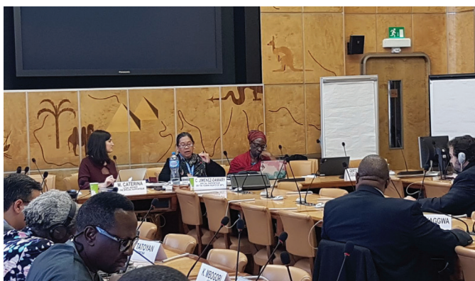
La Rapporteuse spéciale sur les droits de l'Homme des PDI ouvrant la table ronde 2018 avec les INDH

Le présent manuel a été élaboré pendant la pandémie de COVID-19, qui a eu un impact dramatique sur les plus vulnérables, parmi lesquels de nombreuses PDI. Le fait d'être témoin de cet impact a servi de rappel brutal de l'importance d'une approche fondée sur les droits de l'Homme qui donne la priorité au respect, à la promotion, à la protection et à la réalisation des droits de tous, en particulier ceux en situation de vulnérabilité. Le rôle fondamental que les INDH peuvent jouer n'a donc jamais été aussi clair.