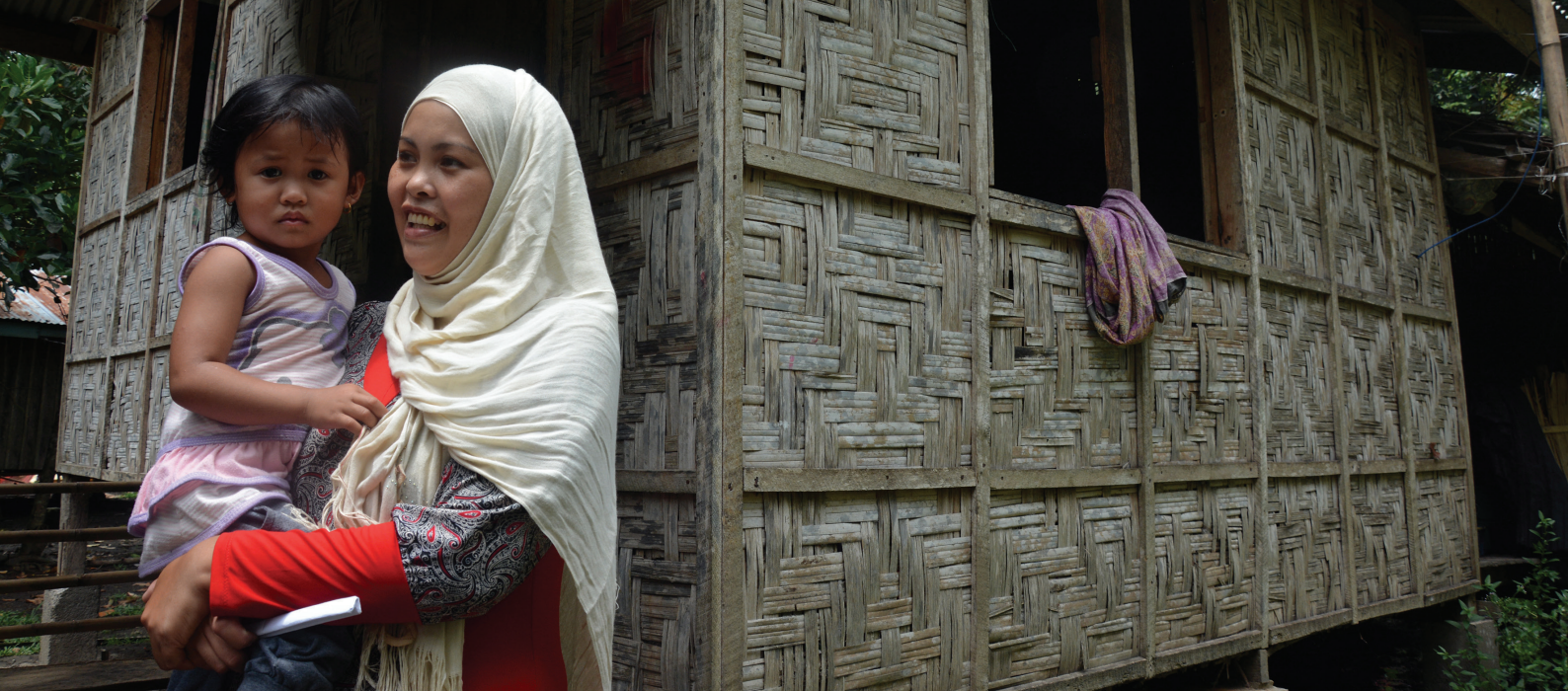
Une femme déplacée avec son enfant à Madiya, aux Philippines (2017).