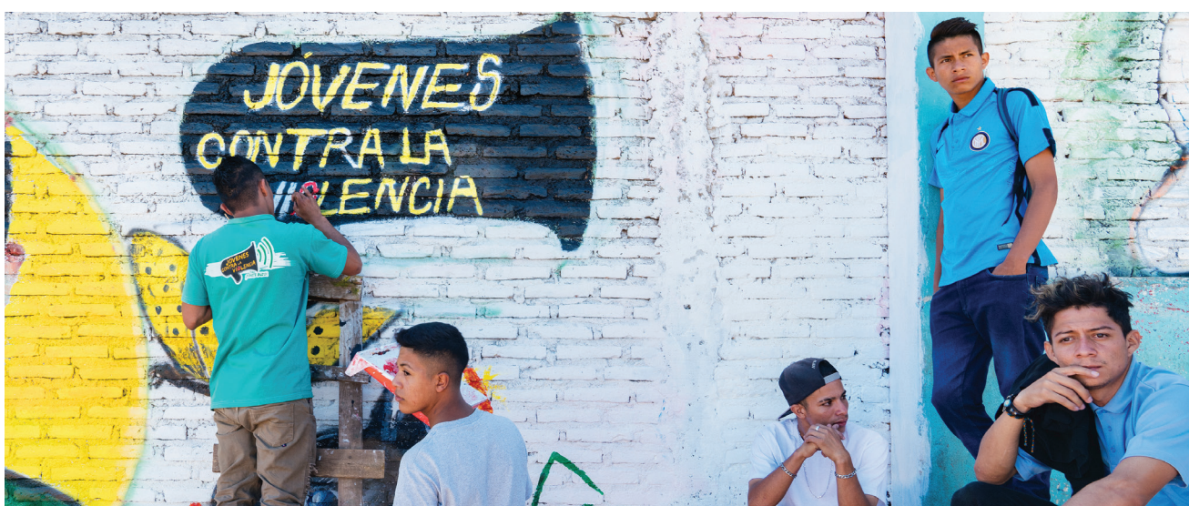
Les dirigeants et bénévoles de l'organisation « Youth Against Violence » (« Les jeunes contre la violence ») à Colonia Nueva Capital, Tegucigalpa, Honduras. L'organisation œuvre dans tout le pays à l'autonomisation des jeunes par le biais d'activités de consolidation de la paix. Son fondateur et directeur, ainsi que sa famille, sont des PDI.