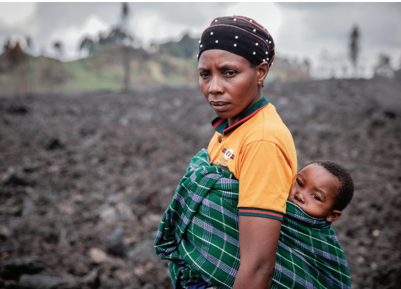
République démocratique du Congo : plus de 350 000 personnes ont été déplacées par l'éruption du volcan Nyiragongo à Goma. Ici, une femme déplacée, âgée de 40 ans, visite avec l'un de ses 7 enfants l'endroit où se trouvait autrefois leur maison (juin 2021).

La Commission a fait preuve de détermination en continuant à plaider non seulement pour la pleine mise en œuvre de la Décision au profit des Endorois, mais aussi pour des réformes juridiques, politiques et institutionnelles globales afin de protéger les droits des communautés locales et des peuples autochtones dans des circonstances similaires. Cet exemple illustre la nécessité d'efforts stratégiques collaboratifs, soutenus et à plusieurs volets fournis par les communautés, la société civile et les INDH afin de promouvoir et de protéger les droits des citoyens vulnérables, en particulier contre les expulsions forcées.