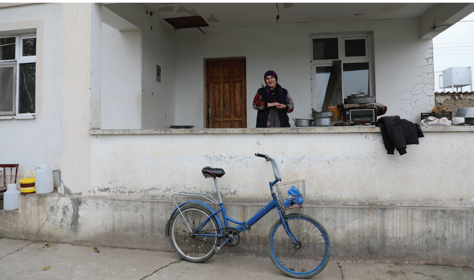
Une azerbaïdjanaise de 51 ans a été déplacée du camp de Dordyol 1 dans la circonscription d'Agdam, près du territoire contesté du Haut-Karabagh (2020).

Travailler avec des financements inadéquats ou incohérents constitue un obstacle fréquemment cité au travail des INDH, entravant leur capacité à défendre les droits de l'Homme des PDI. Dans la mesure où cela est pertinent et faisable, le Budget de base des INDH doit inclure un financement spécifique pour les activités s'attaquant au déplacement interne afin de leur permettre de faire face au déplacement interne par le biais de leurs activités principales et à long terme, plutôt que des fonds temporaires, fondés sur des projets ou ponctuels. Alors que les gouvernements devraient assurer de manière légale un financement adéquat et garantir leur capacité à travailler de manière indépendante, les INDH doivent souvent étendre leurs opérations au moyen des ressources existantes, ce qui a des conséquences évidentes. La capacité des institutions à bénéficier d'un financement externe, conformément aux Principes de Paris, 34 revêt une importance particulière, tout comme la nécessité de travailler avec les donateurs pour approfondir leur compréhension du rôle essentiel et de la valeur des INDH dans ce domaine.