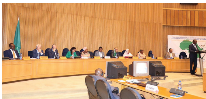
Séance d'ouverture du Forum politique CUA-RINADH sur la situation des institutions africaines des droits de l'Homme, 5 septembre 2019.

Dans le cadre de cette coopération, les deux institutions ont collaboré avec le HCDH et le PNUD afin d'organiser le troisième Forum politique sur la situation des droits de l'Homme en Afrique en 2019, qui s'est concentré sur les solutions durables au déplacement forcé. Cela était conforme au thème 2019 de l'Union africaine (UA) : « Réfugiés, rapatriés et personnes déplacées à l'intérieur de leur propre pays : vers des solutions durables au déplacement forcé en Afrique ». Sur ce forum, les parties prenantes ont élaboré et adopté un plan d'action continental sur la contribution des INDH aux solutions durables au déplacement forcé en Afrique, en insistant fortement sur la promotion de la Convention de Kampala. 69