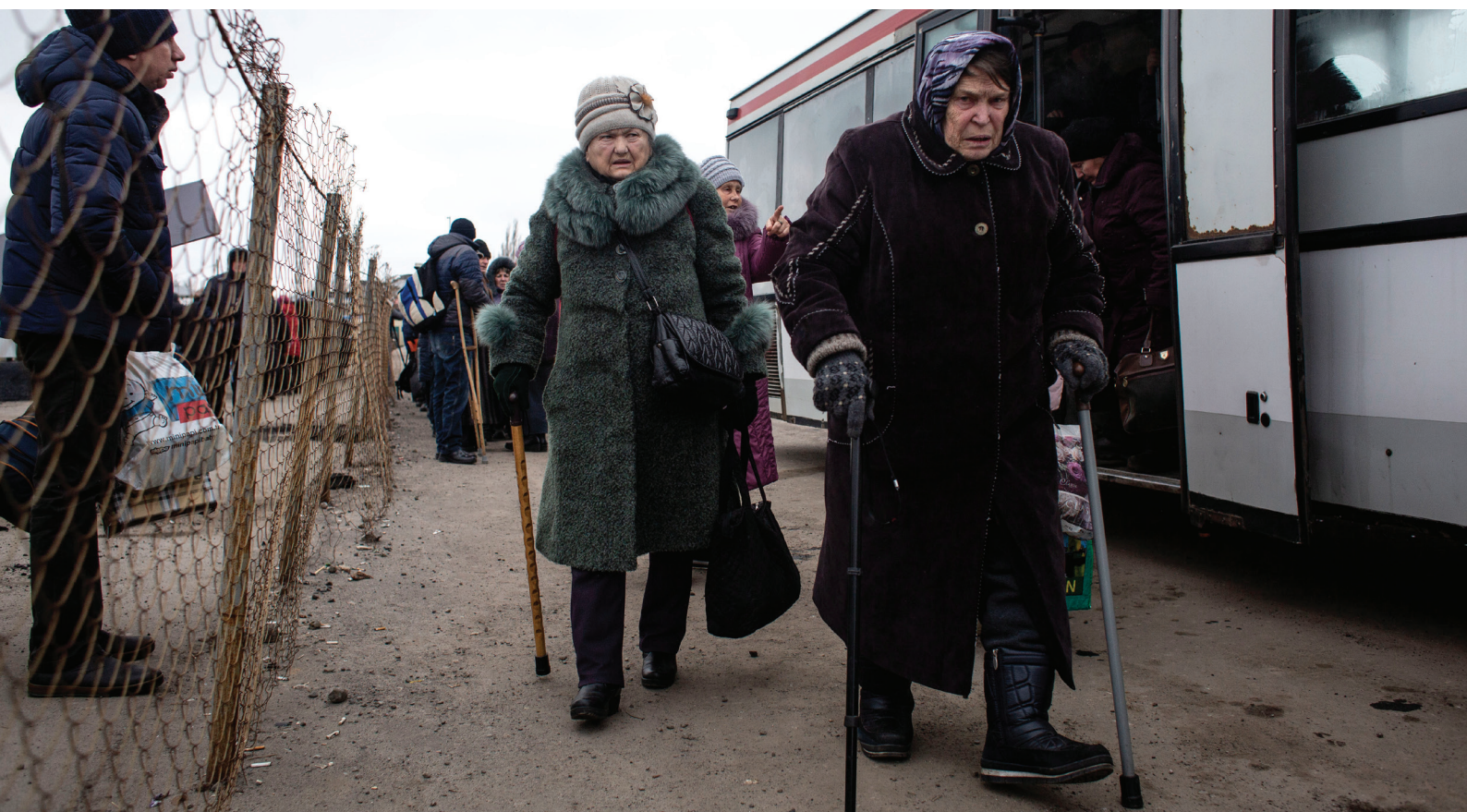
Des résidents de l'est de l'Ukraine franchissent le poste de contrôle frontalier entre la zone contrôlée par le gouvernement et la zone non contrôlée par le gouvernement à Mayorsk, Donetsk (2018).

Selon le Médiateur, une manière plus prévisible et concrète de protéger les droits des PDI et des autres citoyens concernés nécessitait des modifications législatives et, par conséquent, il a soutenu la proposition d'une nouvelle loi, intitulée « Sur les amendements à certaines lois de l'Ukraine concernant l'exercice du droit à une pension » (n° 2083-d du 26 novembre 2019) pour réglementer le versement des pensions aux PDI et aux personnes vivant dans les territoires temporairement occupés de l'Ukraine.