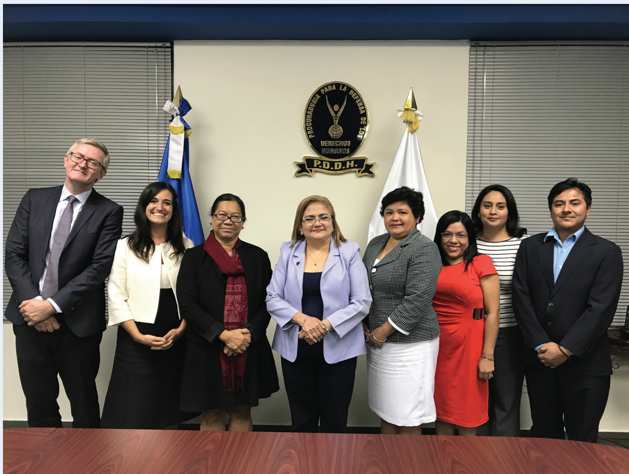
Rencontre de la Rapporteuse Spéciale avec le Médiateur au Salvador lors de sa mission officielle dans le pays en 2017

Les atteintes aux droits de l'Homme sont à la fois une cause et une conséquence du déplacement interne, et le risque d'atteintes aux droits de l'Homme s'accroît pendant le déplacement. La Rapporteuse spéciale rencontre régulièrement les INDH lors d'événements et lors de visites de pays, et reçoit les soumissions et les informations des INDH afin de les communiquer aux États concernant les atteintes aux droits de l'Homme des PDI. La Rapporteuse Spéciale a participé à de nombreux réunions et événements pour parler du rôle des INDH en lien avec le déplacement interne et le promouvoir. Elle réfléchit également aux analyses et aux préoccupations des INDH dans son pays et aux rapports thématiques, en se concentrant plus particulièrement sur la protection et le suivi, la législation et les politiques, ainsi que sur la promotion de la participation des PDI. La Rapporteuse Spéciale peut être contactée à l'adresse mdp@ohchr.org .