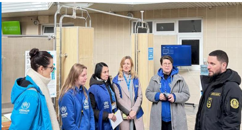
УВКБ ООН та наш партнер БФ «Право на захист» надали підтримку в облаштуванні зони очікування на пункті пропуску «Краковець-Корчова». З 2022 року УВКБ ООН та партнери у тісній співпраці з Державною прикордонною службою працюють на 30 пунктах пропуску, де здійснюють моніторинг ситуації та надають невідкладну допомогу людям на кордонах. © Львівська митниця, 10 березня 2025 року.