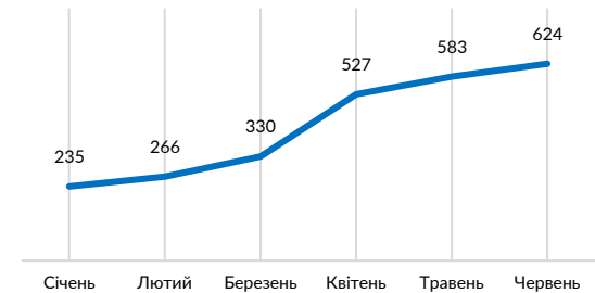
Перетин кордону по місяцям 3 січня по червень 2025 року