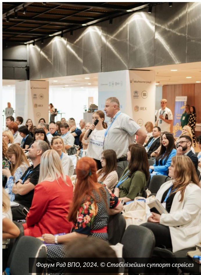
Форум Рад ВПО, 2024.

Здійснюючи активну адвокаційну діяльність у тісній співпраці з органами виконавчої та законодавчої влади, УВКБ ООН і партнери Агентства сприяють важливим змінам і прогресу. Зокрема, УВКБ ООН разом із партнерами започаткували Конгрес Рад ВПО , що посилює цей важливий інструмент залученості ВПО до процесу прийняття рішень; розробили модель фінансування соціальних послуг за принципом «гроші ходять за людиною» для людей похилого віку з-поміж ВПО відповідно до Постанови № 888 КМУ, а також низку законів, що сприяють участі ВПО у програмах компенсації та забезпечення житлом, серед яких Закон № 4080-ІХ, який регулює заходи із забезпечення ВПО житлом, і Закон № 4114-ІХ, що передбачає пріоритетне право для деяких категорій ВПО на отримання компенсацій за знищене майно. УВКБ ООН адвокувало виділення коштів на компенсації ВПО за пошкоджене житло в повному обсязі, результатом чого стало прийняття Постанови № 1432, що регулює виділення 15 мільярдів гривень з державного бюджету на ці потреби. Згідно з розрахунками, це допоможе приблизно 10 000 домогосподарств, які втратили своє житло через війну, отримати компенсації.