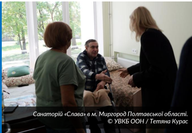
Санаторій «Слава» в м. Миргород Полтавської області.

У Миргороді Полтавської області УВКБ ООН разом із Міністерством соціальної політики здійснило ремонт у санаторії «Слава», перетворивши його на безпечний заклад із гідними умовами проживання для розміщення та надання соціальних послуг людям похилого віку, людям з інвалідністю та вразливим людям з-поміж внутрішньо переміщених осіб, постраждалих внаслідок війни. Відновлення будівлі — це лише частина змін. Санаторій «Слава» став частиною прогресивної пілотної програми, яку УВКБ ООН реалізує спільно з Міністерством соціальної політики та партнерською організацією БФ «Право на захист». Основна мета — підвищити спроможність соціальних працівників санаторію та громади в допомозі переміщеним людям під час соціальної адаптації, що надалі дозволить їм жити самостійно в громаді. Докладніше читайте тут .