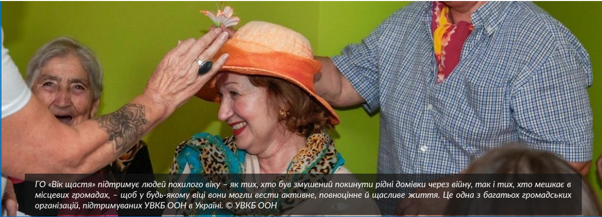
ГО «Вік щастя» підтримує людей похилого віку – як тих, хто був змушений покинути рідні домівки через війну, так і тих, хто мешкає в місцевих громадах, – щоб у будь-якому віці вони могли вести активне, повноцінне й щасливе життя. Це одна з багатьох громадських організацій, підтримуваних УВКБ ООН в Україні.