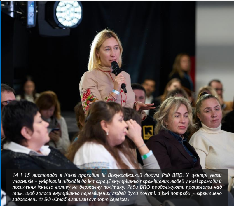
14 і 15 листопада в Києві проходив III Всеукраїнський форум Рад ВПО. У центрі уваги учасників – уніфікація підходів до інтеграції внутрішньо переміщених людей у нові громади й посилення їхнього впливу на державну політику. Ради ВПО продовжують працювати над тим, щоб голоси внутрішньо переміщених людей були почуті, а їхні потреби – ефективно задоволені. © БФ «Стабілізейшен суппорт сервісез»

СПІВПРАЦЯ З РАДАМИ ВПО: Понад 800 Рад внутрішньо переміщених осіб (ВПО) працює при органах місцевої влади в різних областях України. Їхнє завдання – сприяти активній участі тих, хто був змушений покинути рідну домівку через війну, в соціально-політичному житті громад. За підтримки УВКБ ООН і партнера Агентства, БФ «Стабілізейшен суппорт сервісез», ради ВПО стали платформою для діалогу між внутрішньо переміщеними людьми, громадами й місцевою владою, утілюючи в життя фундаментальний принцип «люди захищають людей». Ради ВПО допомагають формувати рішення у сферах забезпечення житлом і засобами для існування, освіти й соціального захисту. Вони сприяють тому, щоб у місцевому плануванні враховувалася думка внутрішньо переміщених людей, щоб ініціативи з відновлення та інтеграції ґрунтувалися на реальних потребах і досвіді цих людей. УВКБ ООН і БФ «Стабілізейшен суппорт сервісез» на сьогодні підтримали створення понад 100 рад ВПО по всій Україні та надали їм допомогу в зміцненні потенціалу. Завдяки постійним ініціативам із нарощування спроможності, зокрема спеціалізованим тренінгам із лідерства, адвокації, залучення громад та управління проєктами, УВКБ ООН та його партнери допомагають радам покращувати їхню ефективність і йти по шляху сталого розвитку. Читайте деталі за посиланням .