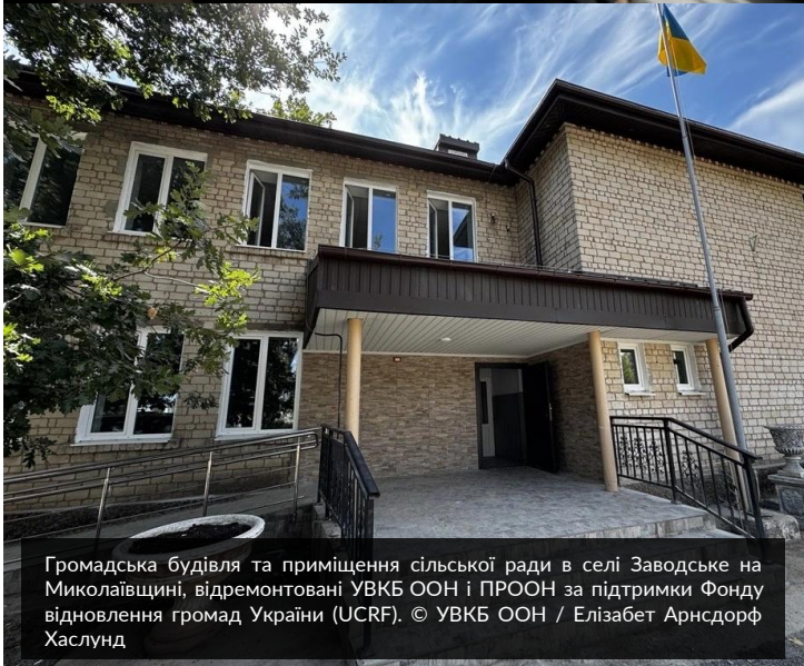
Громадська будівля та приміщення сільської ради в селі Заводське на Миколаївщині, відремонтовані УВКБ ООН і ПРООН за підтримки Фонду відновлення громад України (UCRF).