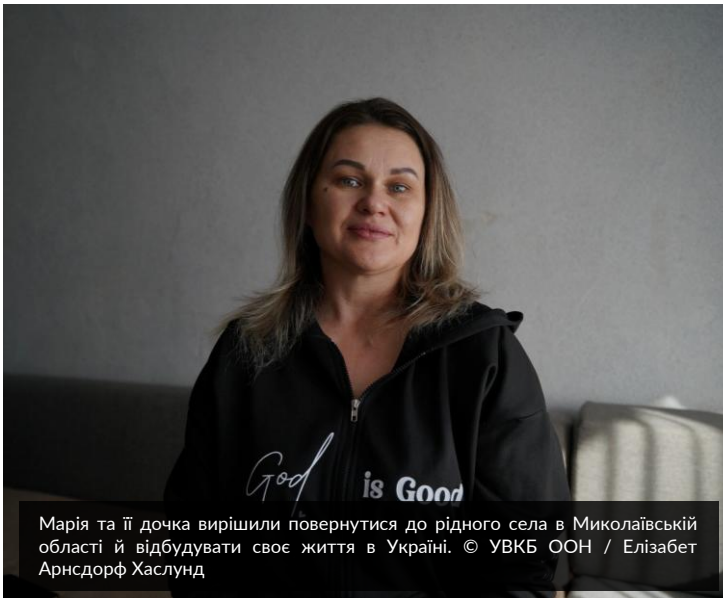
Марія та її дочка вирішили повернутися до рідного села в Миколаївській області й відбудувати своє життя в Україні.