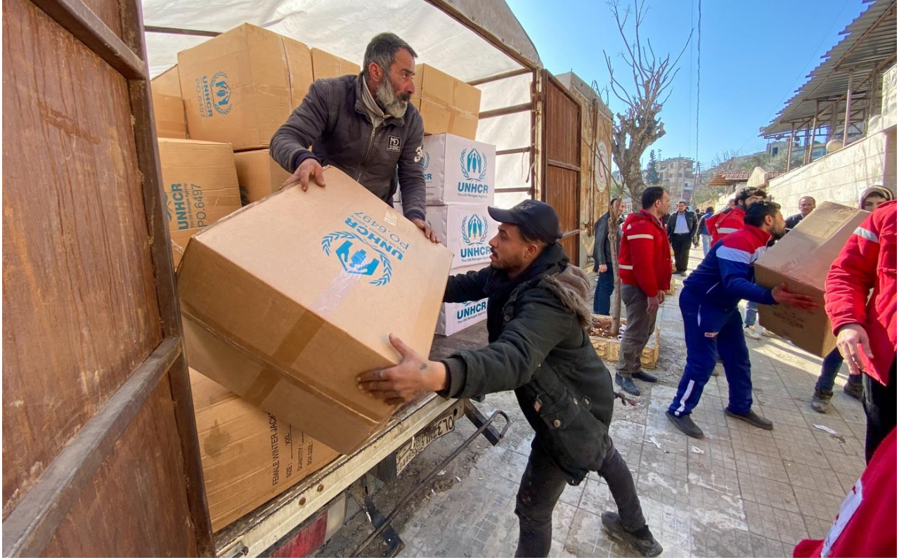
توزيع مواد الإغاثة الأساسية في محافظة حلب