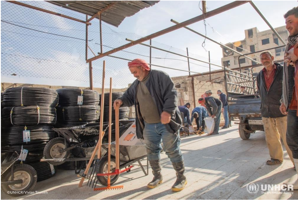
توزيع الأدوات الزراعية للعائلات العائدة إلى ديارها في بيت سوا، بمحافظة ريف دمشق.