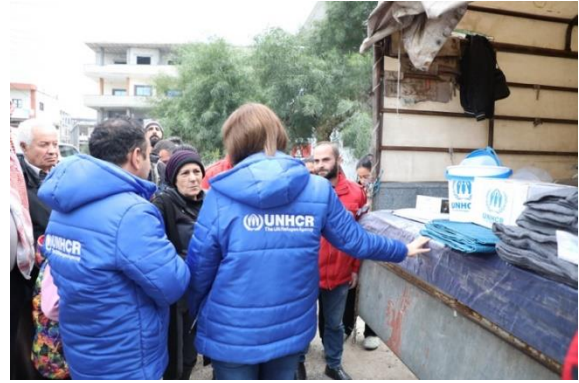
تقوم المفوضية بتسليم حزم مواد الإغاثة الأساسية على وجه السرعة للعائلات المتضررة من الفيضانات في قرية كرتو جنوب طرطوس

كما تمت مساعدة 307 عائلات (1,535 فرداً) في محافظة دير الزور بمواد الإغاثة الأساسية بعد نزوحهم بسبب الأعمال العدائية في شرق دير الزور.