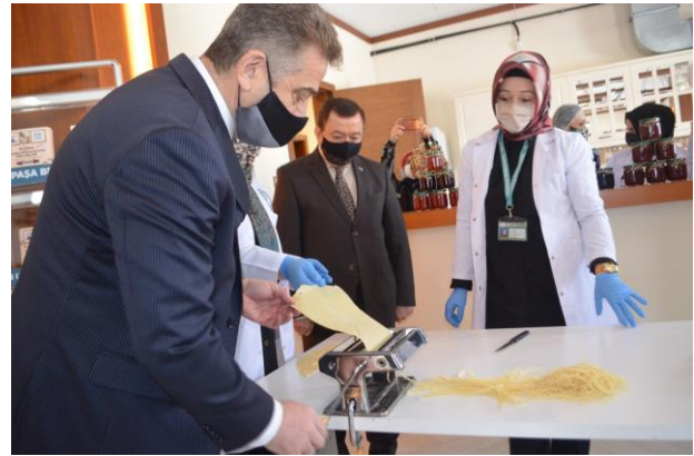
Gaziosmanpaşa Belediyesi ve Dünya Yerel Yönetim ve Demokrasi Akademisi Vakfı (WALD) işbirliğinde Yenilikçi ve Girişimci Kadınların Desteklenmesi Projesi Lansman Toplantısı ©WALD.

İzmir Büyükşehir Belediyesi, 2020 yılında UNHCR ile işbirliği içinde Belediye Personeline Yönelik Mülteciler Rehberi ve Mülteciler ve Yabancılar İçin Çok Dilli Kent Rehberi belgelerini oluşturdu. UNHCR tarafından incelenen belgeler beş dile tercüme ediliyor. Belediye Personeline Yönelik Mülteciler Rehberi , belediye personelinin uluslararası ve geçici koruma mevzuatı, geçici koruma kapsamındaki yabancılar, uluslararası koruma başvuru ve statü sahiplerine sunulan hizmetler ve mevcut yönlendirme mekanizmaları hakkındaki bilgisini artırmak amacıyla hazırlanırken kent ve belediye hizmetleri hakkında bilgiler içeren Mülteciler ve Yabancılar İçin Çok Dilli Kent Rehberi , internette paylaşılıp yabancıların geri bildirimlerine göre düzenli olarak güncellenecek bir belge olma niteliğini taşıyor. Kapsayıcı hizmetlerin sunulmasını desteklemek üzere hazırlanacak basılı belgeler ilçe belediyelerine ve diğer ilgili kurumlara dağıtılacak.