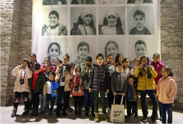
Suriyeli çocuklar, çektikleri fotoğrafların gösterildiği sergi salonunda.

2021’de UNHCR desteğiyle Manisa Şehzadeler Belediyesi bünyesinde de bir mülteci masası kurulmuştur. Saha ziyaretleriyle özel ihtiyaç sahiplerinin Şehzadeler’de sunulan hizmetlere erişimini artırmaya yönelik çalışmalar yapılmıştır. Bu bağlamda yıl boyunca toplam 1.100 kişiye hane ziyaretinde bulunulmuştur.