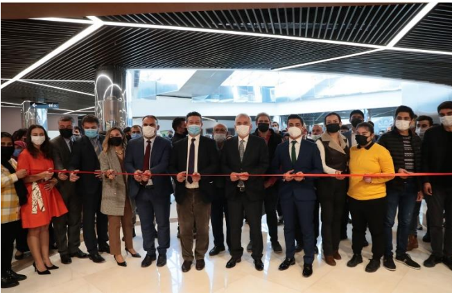
Denizli Büyükşehir Belediyesi, Denizli Kent Konseyi ve UNHCR temsilcileri Denizli Gençlik Akademisi açılışında.

UNHCR, İzmir Kent Konseyi ile “Muhit” adlı bir sosyal uyum projesi gerçekleştirmiştir. Kamuoyunun yabancı algısı ve tutumunu iyileştirmeyi hedefleyen proje kapsamında zorla yerinden edilmiş kişiler hakkında farkındalık oluşturmak için fotoğraflar sergilenmiştir. Usta bir fotoğrafçının verdiği eğitimin ardından İzmir’in dört farklı ilçesinde yaşayan 24 Suriyeli çocuk evlerinin, sokaklarının ve mahallelerinin fotoğraflarını çekmiştir. Çocukların çektiği 72 fotoğraf, İzmir Kent Konseyi, İzmir Belediye Meclisi ve UNHCR tarafından açılan sergide sergilenmiştir.