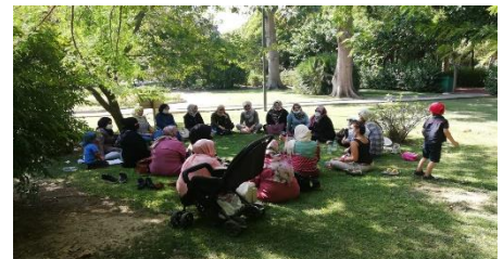
İzmir, Kültürpark'ta Suriyeli kadınlara yönelik bilgilendirme eğitimi.

UNHCR, Yunusemre Belediyesi ve ASAM iş birliğinde Manisa'da geçici ve uluslararası koruma kapsamındaki yabancılara yönelik bilgilendirme ve farkındalık toplantısı düzenlenmiştir. Yaklaşık 370 kişinin katıldığı eğitimde toplumsal cinsiyete dayalı şiddet, sosyal uyum, hak ve hizmetler gibi konular ele alınmıştır.