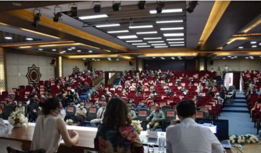
Manisa'da bilgilendirme ve farkındalık toplantısı. @UNHCR

UNHCR, Türkiye'de toplumsal cinsiyete dayalı şiddetle ilgili mücadele, azaltma ve önleme mekanizmaları ve bu konuda sahip olunan hak ve yükümlülüklerle ilgili olarak uluslararası koruma ihtiyacı içindeki kişilere yönelik bilgilendirme ve farkındalık toplantıları düzenlemiştir.