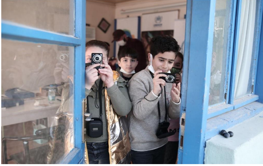
İzmir Kent Konseyi ile UNHCR ortaklığında düzenlenen fotoğrafçılık eğitime katılan yabancı çocuklar.

UNHCR'ın yürüttüđü koordinasyon faaliyetleri uluslararası koruma ihtiyacı içindeki kişilere yönelik sahadaki çalışma ve yardımların mükerrere düşmeden eksiksiz bir şekilde yönlendirilmesinde kritik öneme sahiptir. Salgınin devam etmesi ve kötüleşen şartlar dikkate alınarak sektörler arası koordinasyon platformuna ek olarak çocuk koruma, toplumsal cinsiyete dayalı şiddet, koruma ve temel ihtiyaçlar sektörlerinde özel çalışma grupları oluşturulmuş, bölgedeki özel ihtiyaçların daha iyi tespit edilmesi ve buna göre ortaklarla birlikte etkili müdahalelerde bulunulması için koordinasyon çalışmalarına hız verilmiştir.