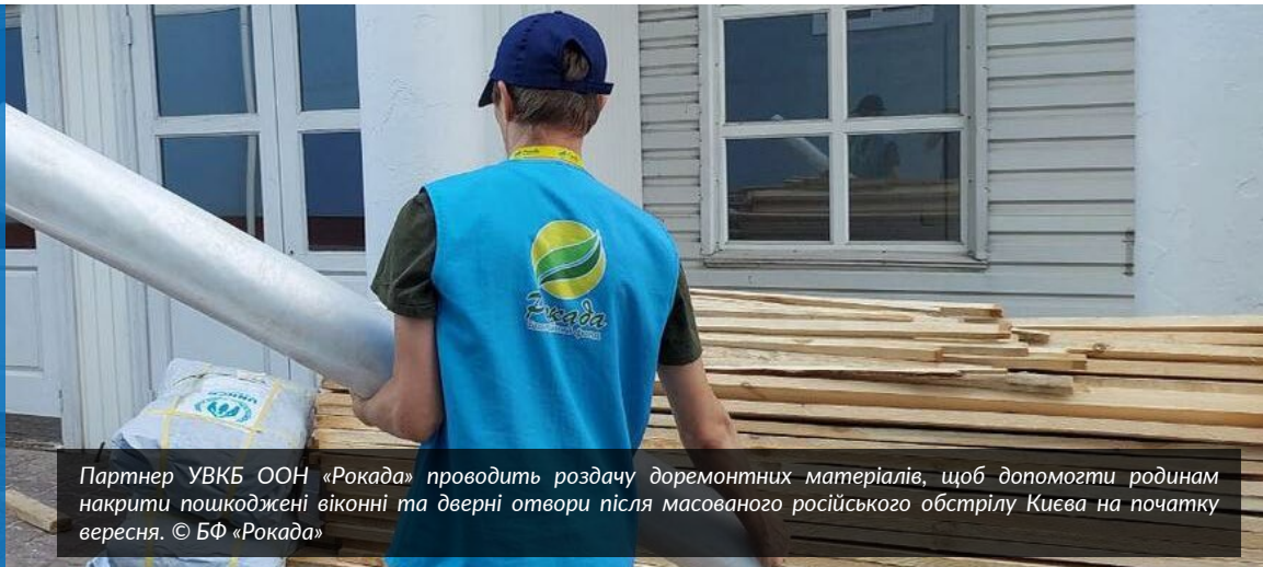
Партнер УВКБ ООН «Рокада» проводить роздачу доремонтних матеріалів, щоб допомогти родинам накрити пошкоджені віконні та дверні отвори після масованого російського обстрілу Києва на початку вересня.

Огляд ситуації: війна в Україні призвела до руйнувань або пошкоджень понад 2 млн одиниць житла, згідно з Третьою швидкою оцінкою завданої шкоди та потреб на відновлення України . Відповідно, мільйони українців потребують різних типів підтримки у сфері житла. УВКБ ООН підтримує такі групи населення: