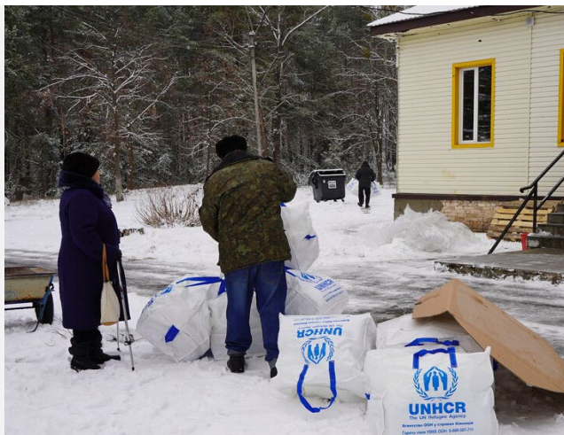
Місце роздачі наборів для сезонного утеплення від УВКБ ООН та партнера «Право на захист» у Київській області.

повномасштабні російські обстріли і далі руйнують енергетичні об'єкти по всій країні, що з наближенням зими може мати жахливі наслідки для якості повсякденного життя людей в Україні. У рамках Плану реагування упродовж осінньо-зимового періоду 2024-2025 рр. та доповнюючи більш ширший міжагентський план реагування , УВКБ ООН і далі надаватиме підтримку у сфері житла постраждалим від війни людям, щоб допомогти їм пережити зиму. До запланованих заходів входить роздача наборів для сезонного утеплення житла для приватних будинків, квартир та МТП. До цих наборів входять нагрівачі та матеріали для утеплення, наприклад, тепловідбиваючі екрани, поліетиленова прозора плівка для вікон, поролоніві ущільнювачі та будівельна стрічка. Крім цього, заплановано утеплення будинків, квартир та МТП, які не відповідають потрібним стандартам, для покращення теплоізоляції будівель, зменшення витрат на опалення та економії енергії через утеплення дахів та горіщ, встановлення дверей та сучасних вікон з потрійними склопакетами. За умови отримання достатнього фінансування УВКБ ООН планує утеплити будинки та приміщення 19 700 домогосподарств (приблизно 41 400 людей) цієї зими.