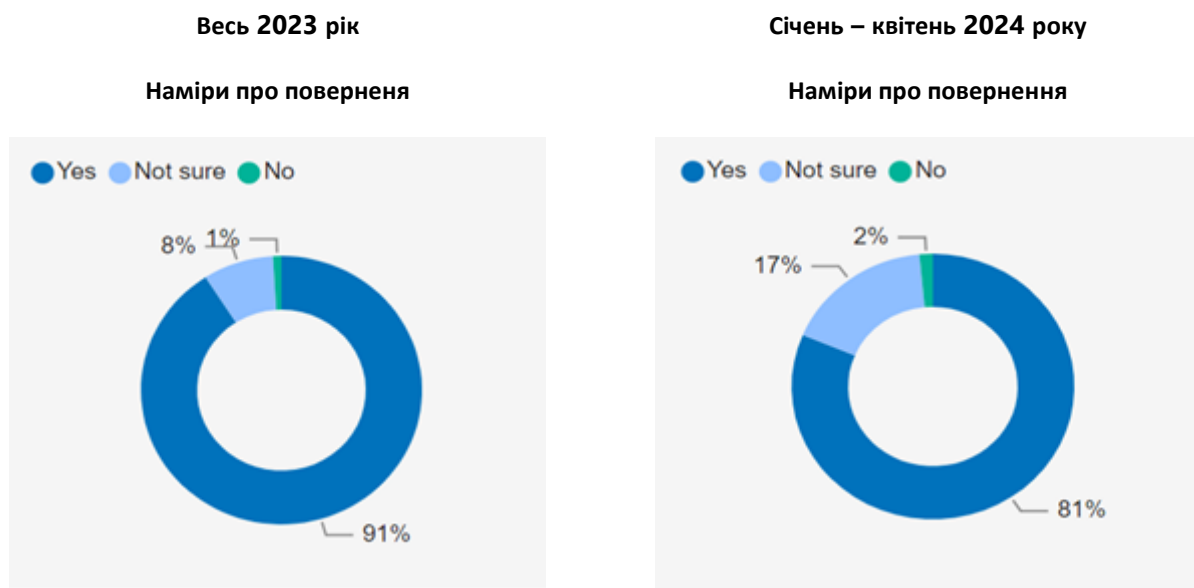
Фігура 3 . Дані на основі прикордонного моніторингу УВКБ ООН за 2023 та 2024 роки відповідно.