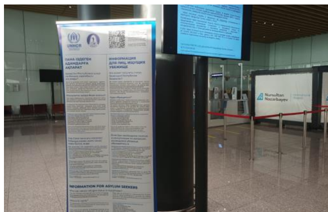
Информация о национальных процедурах предоставления убежища в зале прилета Международного аэропорта имени Нурсултана Назарбаева в Астане.