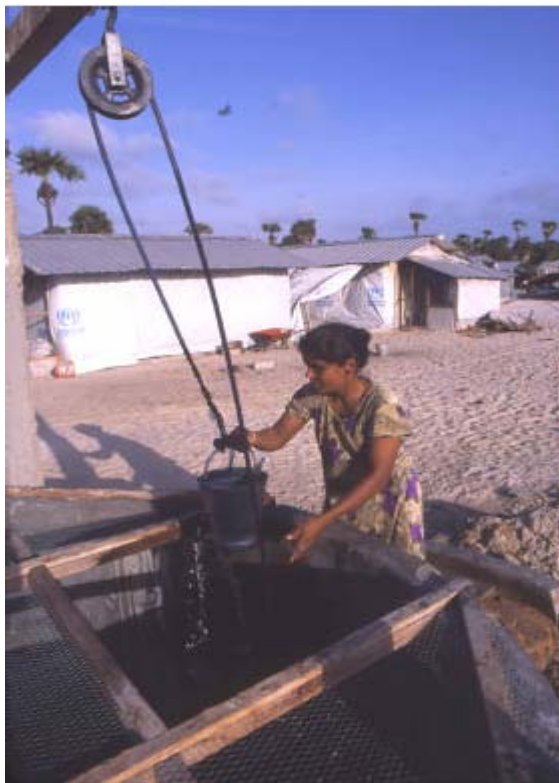
Une femme déplacée au centre d'accueil de Nathampiron dans le district de Jaffna, au Sri Lanka, tire de l'eau d'un puits, devant son nouveau logement construit par l'UNHCR.

Durant les jours qui ont suivi la catastrophe, l'UNHCR a rapidement mobilisé des ressources d'urgence pour fournir une assistance immédiate en Indonésie et au Sri Lanka. Bien que l'UNHCR ne s'implique traditionnellement pas dans les catastrophes naturelles, l'ampleur du désastre, mais aussi le fait que l'UNHCR soit déjà implanté sur les lieux et ait les moyens d'intervenir rapidement, et que de nombreuses personnes touchées par la catastrophe sont sous la protection de l'UNHCR, ont conduit l'agence des réfugiés à accepter la demande de l'équipe pays du système des Nations Unies qui souhaitait qu'elle participe aux opérations.