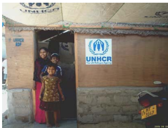
Une famille devant sa nouvelle maison, construite par l'UNHCR et son partenaire RDF, dans le district d'Ampara, au Sri Lanka.

certificats de mariage, actes de propriété...). Suivant cette initiative, l'UNHCR a géré de plus de vingt centres dans les districts de Hambantota, Galle, Ampara, Batticaloa, Mullaitivu et Kilinochchi, afin d'assurer le remplacement des papiers d'identité perdus ou détruits à cause du tsunami. Un service gratuit d'aide aux questions juridiques a été mis en place par la Commission des droits de l'homme (fondée par l'UNHCR) et la Commission d'aide légale (Fondée par la Fondation Asie).