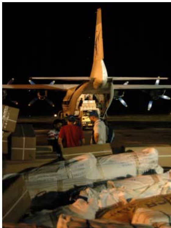
L'une des premières livraisons de matériel de secours à Banda Aceh.

L'UNHCR a aussi travaillé avec le gouvernement indonésien et d'autres acteurs afin d'encourager les efforts entrepris pour trouver des solutions durables aux problèmes de logement. Cette collaboration a permis la conception d'abris temporaires plus adaptés aux familles et différenciés selon les sexes, ainsi que l'élaboration d'un programme de construction de logements durables dans une optique de réhabilitation.