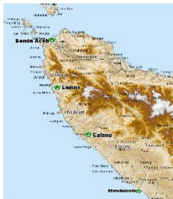
L'UNHCR dans la province d'Aceh : janvier-mars 2005

Des équipes mobiles ont été déployées pour faciliter et contrôler la distribution du matériel de secours dans les régions les moins accessibles le long de la côte ouest. Une aide ciblée a été apportée aux 100 000 personnes touchées par la catastrophe, cela au moyen d'une distribution d'abris de secours (toiles en plastiques et tentes) et autres éléments de secours (bidons d'eau, ustensiles de cuisine, couvertures et matelas).